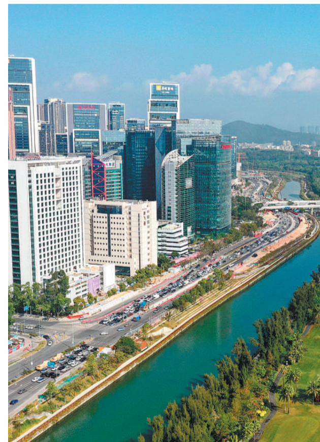
图为深圳南山区大沙河两岸景观。目前,深圳水环境实现转折,茅洲河、深圳河等五大河流考核断面水质,全部达到或优于地表水Ⅴ类标准;福田河、大沙河、观澜河、龙岗河、坪山河等河流,呈现水清岸绿、鱼翔浅底的美丽景象,成为城市新的风景线 and 市民休闲的好去处。