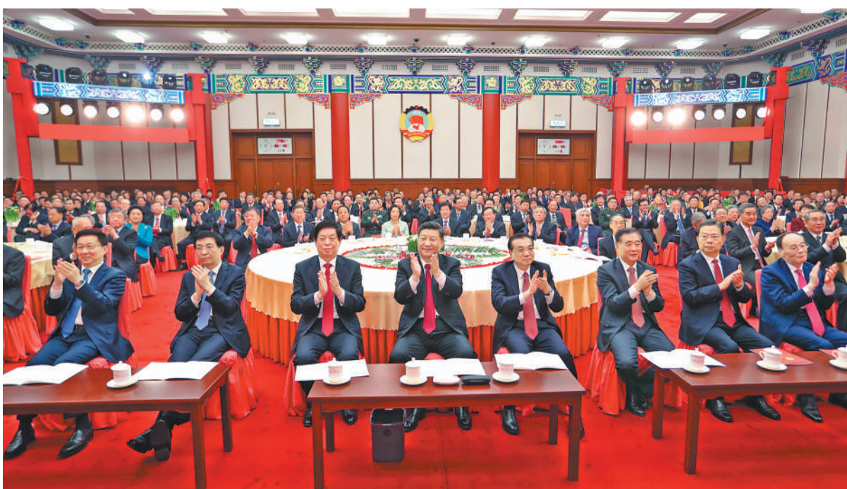
12月31日,全国政协在北京举行新年茶话会。党和国家领导人习近平、李克强、栗战书、汪洋、王沪宁、赵乐际、韩正、王岐山出席茶话会并观看演出。