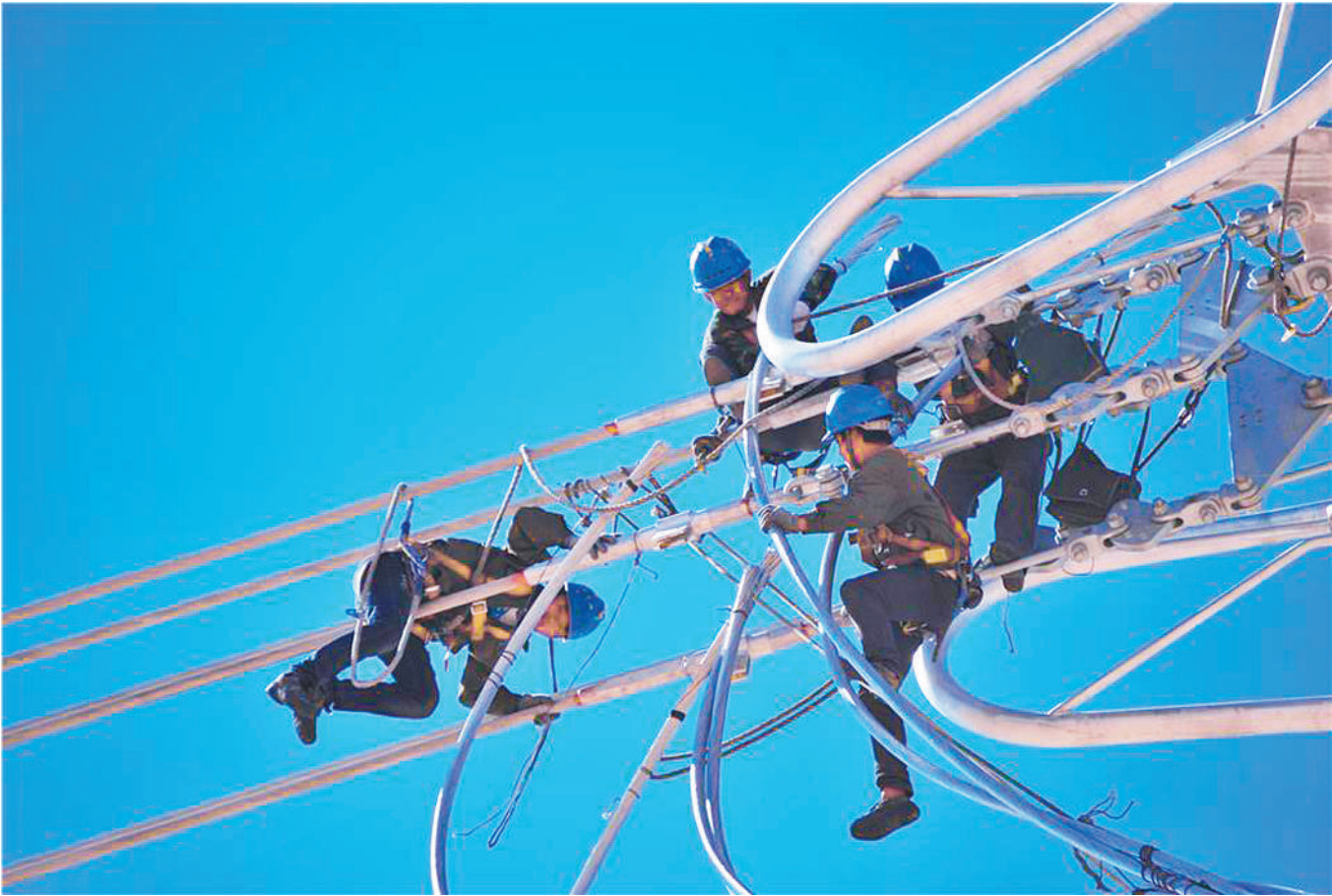
河西走廊750千伏第三回线加强工程施工人员在高空作业。（资料图片）

沿着河西走廊一路向西，在晶莹的祁连雪山下，在万里黄沙的戈壁里，一座座铁塔巍然屹立，一条条银线排列有序。12月19日，甘肃河西走廊750千伏第三回线加强工程建成投运。这条新添的新能源外送通道，优化了甘肃电网格局，解决了甘肃电力外送电网断面阻塞问题，激活了甘肃、宁夏、青海、新疆地区电力外送的棋局，为我国西北新能源发展注入了强大动力。