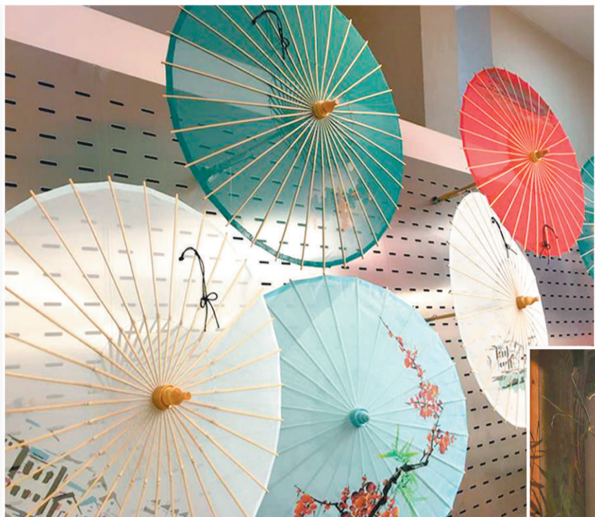
▲ 杭州工艺美术馆一景。 沈慧摄 ▶ 现如今的富义仓，已成为文化创意企业青睐的地方。 沈慧摄