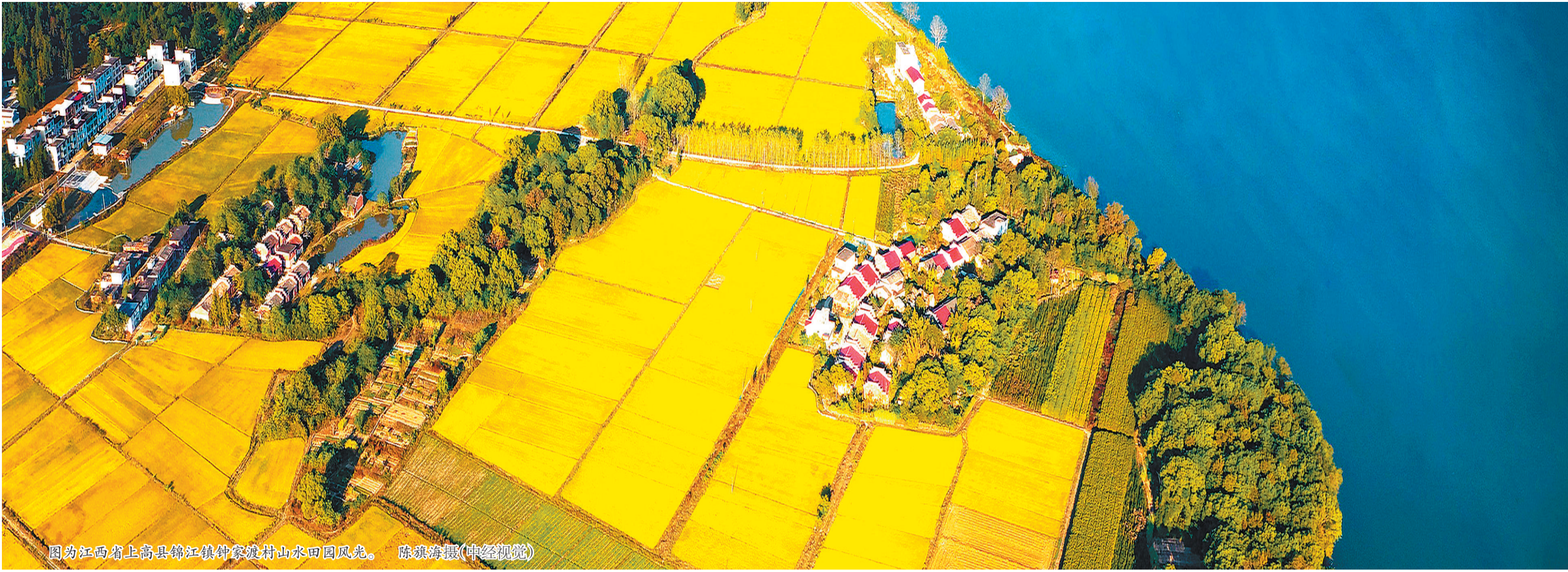
图为江西省上高县锦江镇钟家渡村山水田园风光。