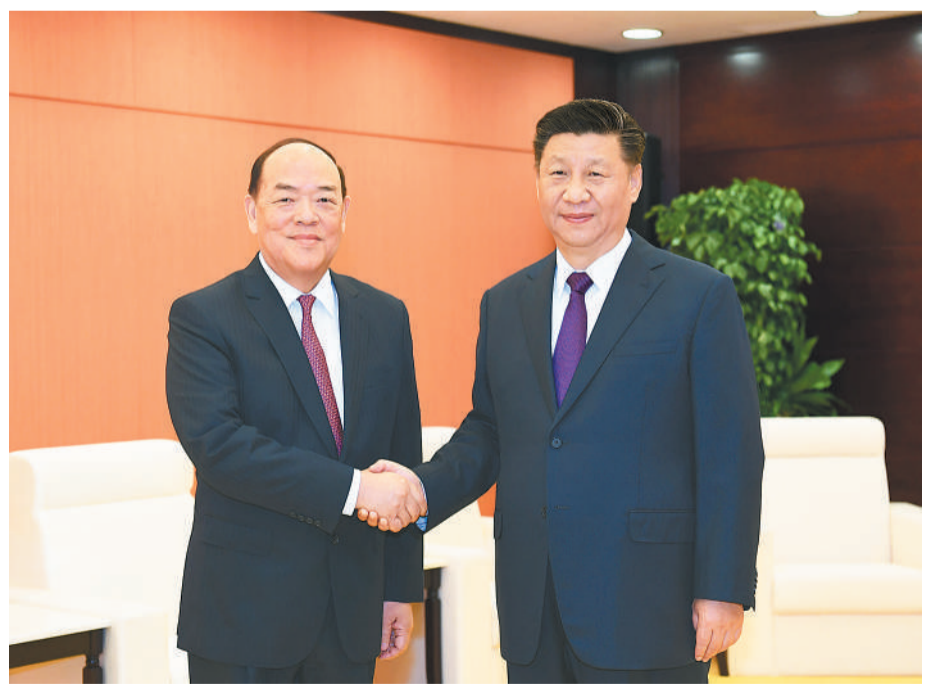
12月20日,国家主席习近平在澳门会见刚刚就职的澳门特别行政区行政长官贺一诚。

习近平祝贺贺一诚就任澳门特别行政区第五任行政长官。他表示,从今天开始,你就要承担起领导澳门特别行政区的重任。中央政府对你高度信任,澳门居民对你充满期待。希望你带领特别行政区政府全面准确贯彻“一国两制”方针,严格依照宪法和基本法办事,稳健施政,奋发有为,在前几届政府打下的良好基础上,不断推进澳门经济发展、民生改善、社会和谐,并积极参与共建“一带一路”和粤港澳大湾区建设,把澳门建设得更好。中央政府将全力支持你和特别行政区政府的工作。 贺一诚感谢习近平主席和中央政府的信任。他说,新一届特别行政区政府将切实加强管治团队建设,着眼长远,破解难题,确保经济持续稳定发展。他表示,一定会带领特别行政区政府努力工作,请习主席放心。 丁薛祥参加会见。