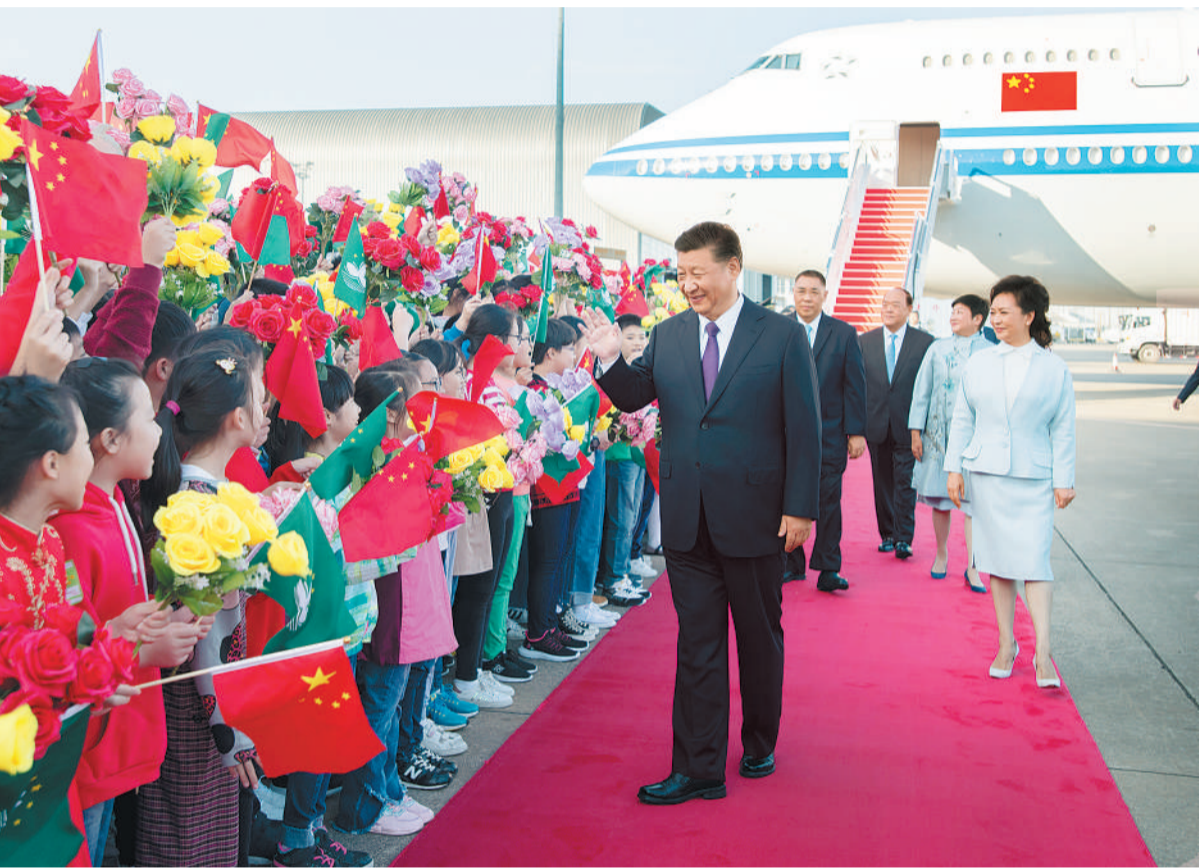
12月18日,中共中央总书记、国家主席、中央军委主席习近平乘专机抵达澳门,出席将于20日举行的庆祝澳门回归祖国20周年大会暨澳门特别行政区第五届政府就职典礼并视察澳门。这是习近平和夫人彭丽媛向欢迎人群致意。新华社记者 谢环驰摄

新华社澳门12月18日电 (记者陈键兴 郭鑫) 中共中央总书记、国家主席、中央军委主席习近平18日下午乘专机抵达澳门,出席将于20日举行的庆祝澳门回归祖国20周年大会暨澳门特别行政区第五届政府就职典礼并视察澳门。