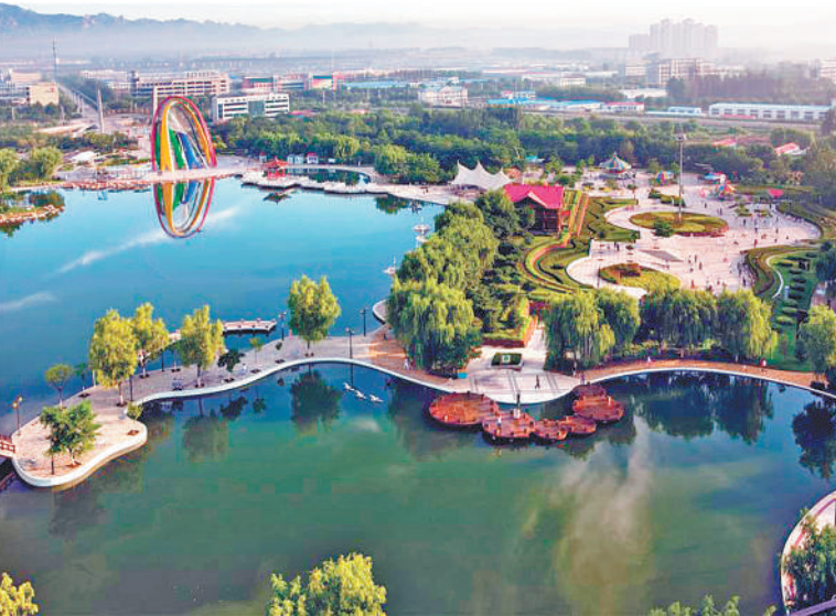
秦皇岛森林体育公园湖区。

“河北省秦皇岛开发区通过生态修复,将昔日采石场遗留下的城市“疮疤”改造成山美水美、特色鲜明的生态景观,并强化日常监管、严格企业准入、全面实现清洁生产,不仅让环境变美,还为区域经济发展增添了强劲动力。