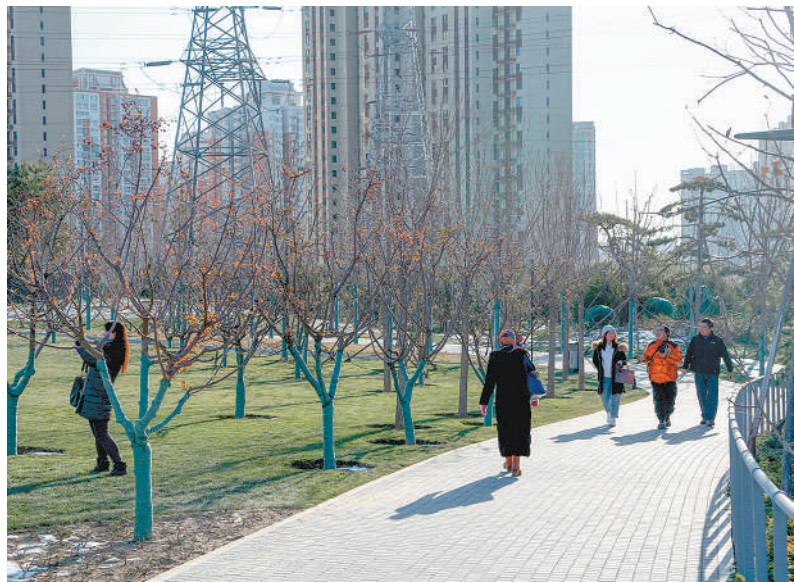
新近建成的北京市朝阳区太阳宫安馨公园,成为附近居民休闲、健身的好地方。

活感受。在位于西城区菜市口西北角的广阳谷城市森林公园,一群群飞鸟在树林里翻飞啁啾;在北京会议中心湖面上,一群黑天鹅和野鸭等水禽在水中嬉戏;在北京延庆世园会园区北侧的自然生态展示区内,原有的湿地和林地被保留下来,妫水河中的小岛上栖息着100多种鸟类、昆虫。