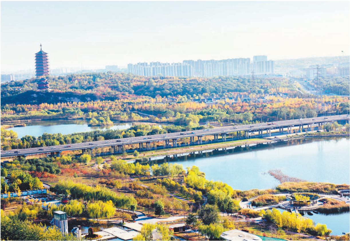
北京市石景山区的莲石湖公园美景。

“北京市将生态环境保护作为落实新发展理念、加强生态文明建设、推动京津冀协同发展的重要内容,全面推进污染防治攻坚,加快生态文明体制改革,实现了城市发展的绿色转型。一个天蓝、水清、土净、地绿的美丽北京正展现在人们面前。