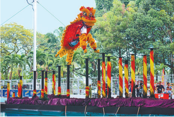
日前，第一届马来西亚国际水上跳桩狮王争霸赛在吉隆坡举行。图为新加坡艺威体育会舞狮队在比赛中。