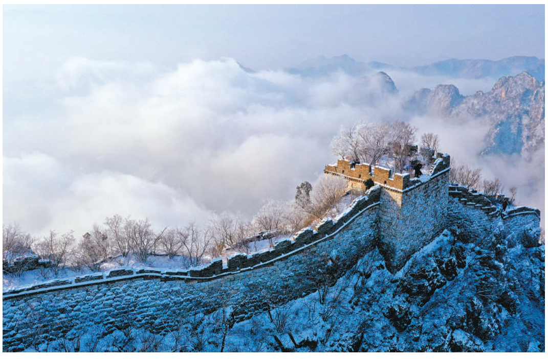
北京怀柔箭扣长城雪景(11月30日摄)。晶莹剔透的树挂与蜿蜒的长城交相辉映,构成了一幅壮观的长城冬雪美丽画卷。

《方案》明确,要坚持保护优先、强化传承,文化引领、彰显特色,总体设计、统筹规划,积极稳妥、改革创新,因地制宜、分类指导,根据文物和文化资源的整体布局、禀赋差异及周边人居环境、自然条件、配套设施等情况,重点建设管控保护、主题展示、文旅融合、传统利用4类主体功能区。 《方案》要求,要修订制定法律法规,推动保护传承利用协调推进理念入法入规;要按照多规合一要求,结合国土空间规划,分别编制长城、大运河、长征国家文化公园建设保护规划;要协调推进文物和文化资源保护传承利用,系统推进保护传承、研究发掘、环境配套、文旅融合、数字再现等重点基础工程建设;要完善国家文化公园建设管理体制机制,构建中央统筹、省负总责、分级管理、分段负责的工作格局,强化顶层设计、跨区域统筹协调,在政策、资金等方面为地方创造条件。要加强组织领导和政策保障,广泛宣传引导,强化督促落实,确保《方案》部署的各项建设任务落到实处。