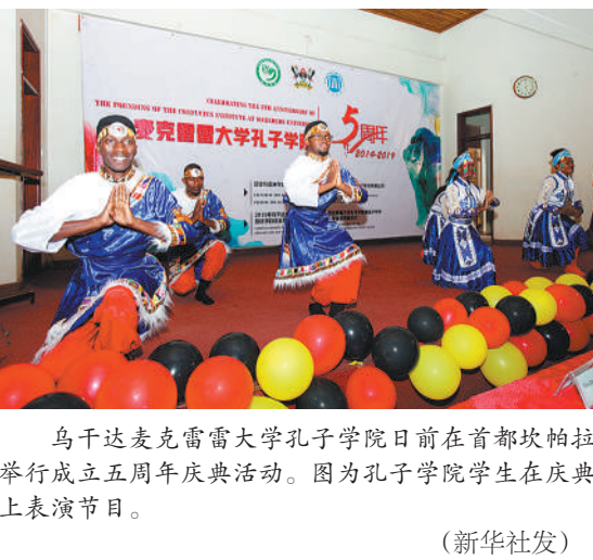
乌干达麦克雷雷大学孔子学院日前在首都坎帕拉举行成立五周年庆典活动。图为孔子学院学生在庆典上表演节目。（新华社发）