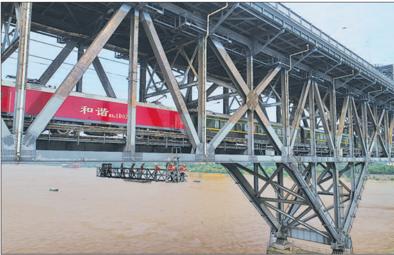
► 九江桥工段大桥检查班员工在悬挂于大桥钢梁下的“吊篮”里作业。