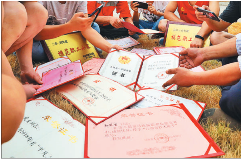
◀ 20多年来，九江桥工段大桥检查班获得许多荣誉。