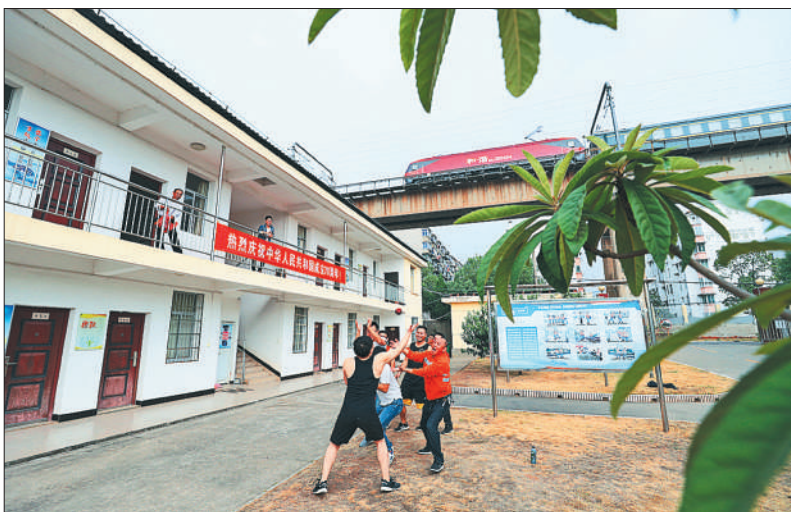
► 九江桥工段大桥检查班员工开展文体活动，丰富文化生活。