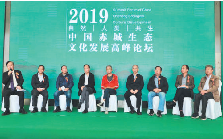
上图 在“中国赤城生态文化发展高峰论坛”上,《中国赤城生态文化发展宣言》发表。(资料图片)