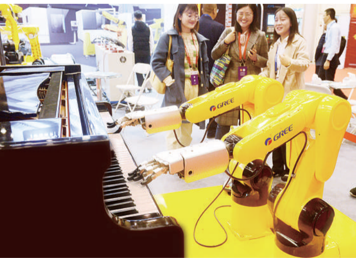
11月18日，郑州国际会展中心，观众在参观机器人弹钢琴。11月18日至22日，2019年中国技能大赛——第三届全国智能制造应用技能大赛决赛在郑州举行。大赛设置装配钳工、维修电工、模具工和无线电调试工4个赛项，共有来自全国28个省(区、市)及机械行业361支参赛队的1015名选手参赛。