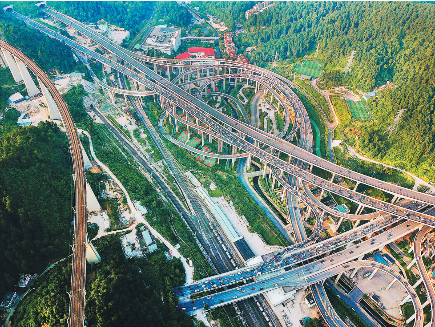
贵州省贵阳市作为全国首个国家森林城市，拥有70公里长的环城林带与充沛的湿地资源，具备鲜明的城中有林、山水围城、宜居宜游的森林城市特色。