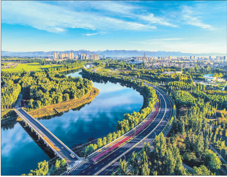
北京市平谷区洳河河岸人造林景观优美，成为市民休闲娱乐好去处。