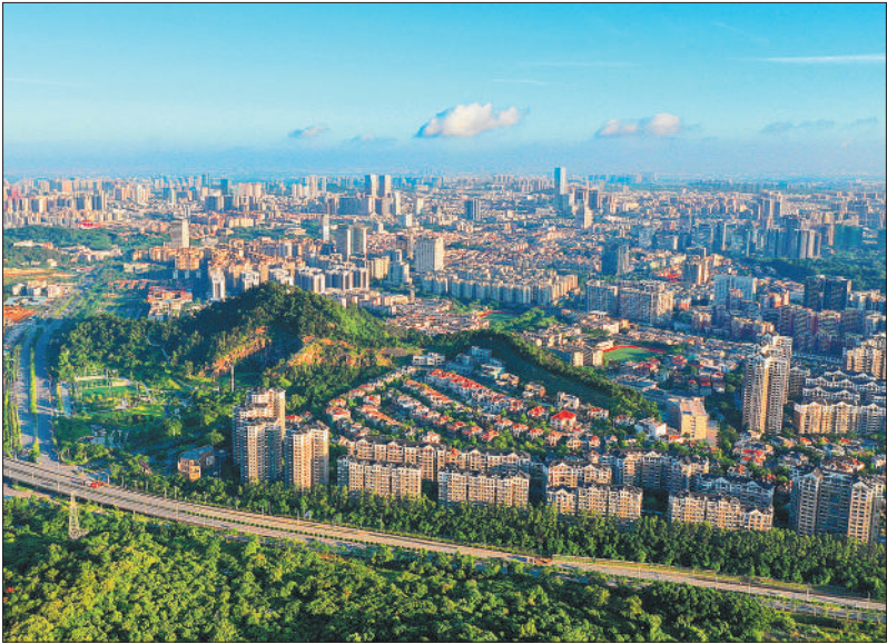
广东省中山市森林与城市交相辉映。近年来，中山市将林业融入整个生态环境中，建设多树种、多层次、多色彩的森林绿化景观，让森林走进城市，让城市拥抱森林。