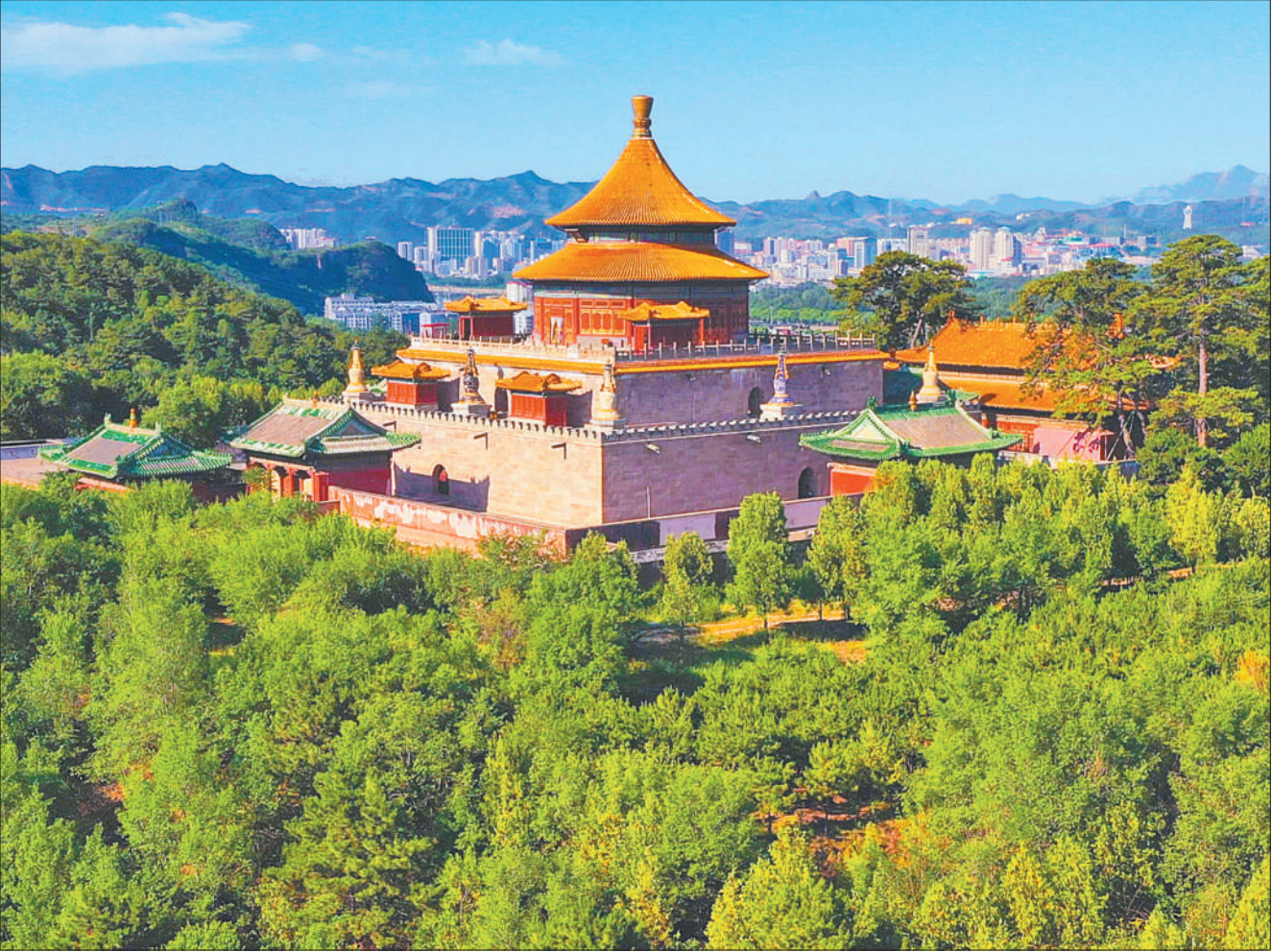
河北省承德市双桥景区内，绿树成荫，景色宜人。近年来，承德市把森林生态作为一张名片，坚持既要金山银山，更要绿水青山的理念，打造推门见绿、远眺见景的宜居城市。