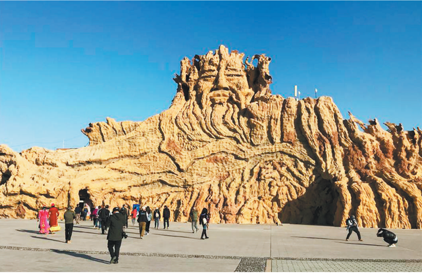
新疆哈密伊吾县胡杨林生态园景区迎来大批游客。

其实，夜游产品早在2016年已经在新疆旅游热点城市——吐鲁番兴起。为了拉长当地旅游文化产业链，当地推出了“夜游交河”“夜读苏公塔”“夜游坎儿井”等旅游产品。一方面，可以让游客避开吐鲁番夏季炎热天气，另一方面可以拓宽旅