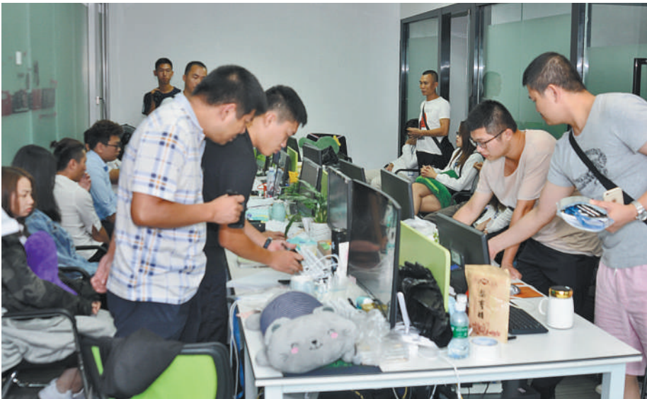
广东湛江市网警支队侦查出两个“第三方支付平台”新型犯罪团伙,并发现由其组成的犯罪产业全链条。图为案件破获现场。

鉴于此类犯罪手法新颖、性质恶劣,广东省公安厅将该案列为“净网19号”专案。9月2日,在掌握了犯罪团伙组织架构以及涉案人员的相关信息后,专案组在深圳、上海等地同时开展收网行动,共抓获犯罪嫌疑人63人,查获大批涉案手机主板、电脑、手机、银行卡等物品,给予该犯罪团伙手机系统开发商、手机硬件