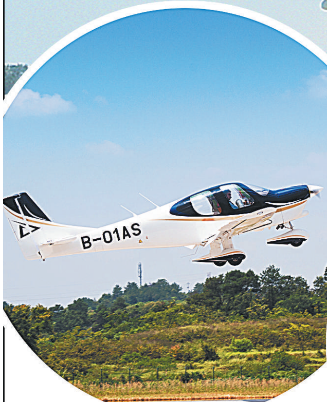
中国民企完全自主知识产权通用飞机冠一通航GA20