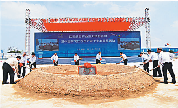
中国商飞江西生产试飞中心奠基

“让通用航空器飞起来，让通用航空飞行爱好者热起来”。通用航空作为与群众联系紧密的业态，正以其丰富的航空体验释放出强大的吸引力。近年来，“华夏九州”“江西快线”等通航企业的悉数亮相，为南昌新兴通航消费市场的畅旺带来了蝴蝶效应，以“初教-6”飞机率先成为全国军转民飞机契机，大力培育通航消费市场，推动“通航+旅游”“通航+运动”等通航服务新业态蓬勃发展。通航产业主要面临市场、人才、基础设施等难题有待解决。南昌的通航产业具有研发制造优势，为市场培育奠定了基础。直升机旅游、航空婚礼、空中游览……未来，对普通人来说，这些空中飞行项目都不再“高不可攀”。华夏九州通航依托航空工业昌飞的强大技术力量支持，将建成包括直升机会展、航空科普、飞行员培训、飞行体验、商务等服务的一体化中心。通航运营基地位于江西南昌瑶湖东南侧，包括直升机机场、飞行调度中心、机务航务培训学校、直升机销售与租赁、直升机维修维护中心、通航运营服务等。伴随着近年来南昌航空城的快速建设，江西“航空梦”已经展开羽翼，乘势而飞。（数据来源：南昌高新区管委会）