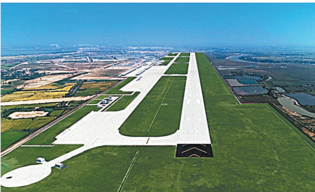
2019南昌飞行大会在瑶湖机场举办