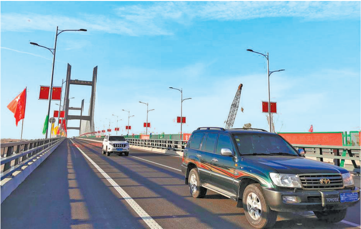
10月31日，新疆首座双塔混凝土斜拉索大桥——可克达拉大桥正式通车。一桥飞架南北，市域两岸从此告别了隔河相望，结束了新疆生产建设兵团第四师成立以来伊犁河两岸团场60多年不能直接通行的历史，为城市“一河两岸、跨河发展”注入强大动力。

党的十八大以来，通过精准扶贫，全国每年都保持减贫1200万人以上，创造了举世瞩目的人间奇迹。