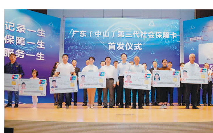
10月30日，广东(中山)第三代社会保障卡首发仪式在中山市举行。据悉，与上一代社会保障卡相比，第三代社会保障卡增加了非接触读卡用卡和小额快速支付功能，使用更加方便。图为首发仪式上，市民领取广东省第三代社会保障卡。