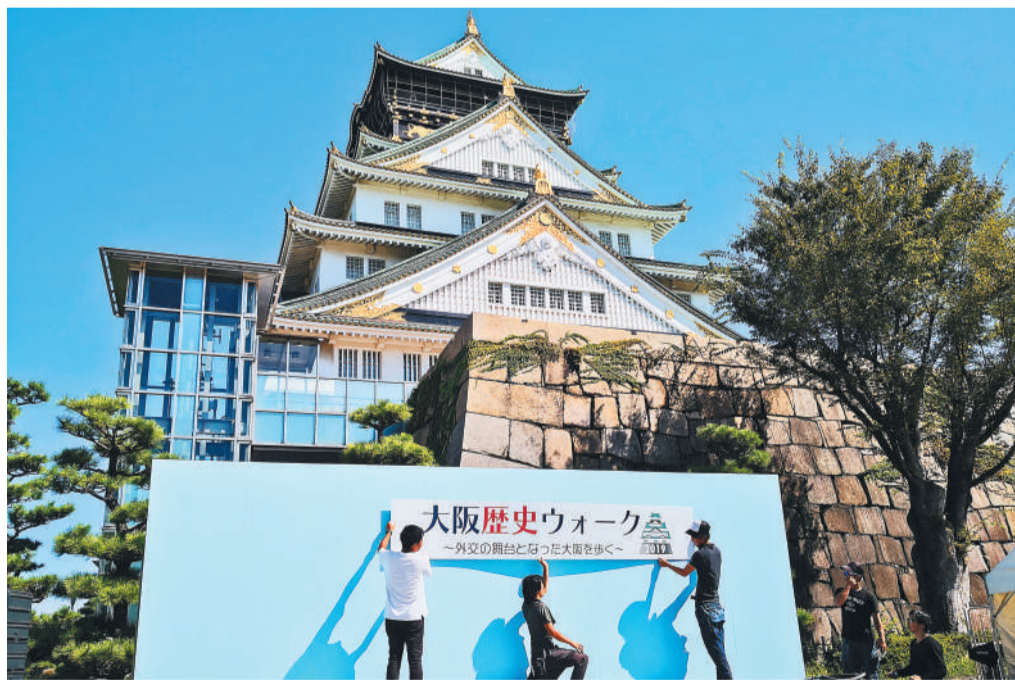
在大阪公园天守阁前，工作人员正一丝不苟地布置舞台和展板。