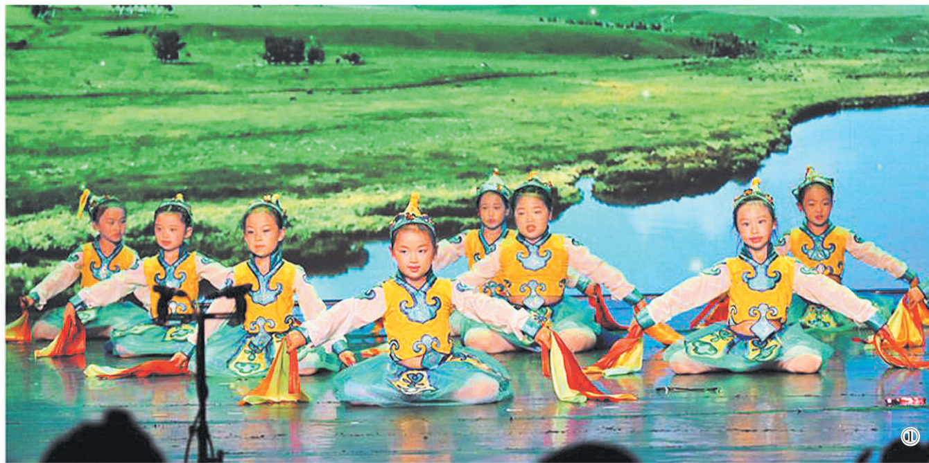
图① 由匈牙利华星艺术团组织的庆祝晚会精彩纷呈。图为匈牙利华人小朋友表演歌舞。