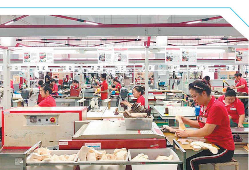
奥康“智造工厂”自投产以来,日产鞋面可达3500双至4000双。

在重庆,类似南电科技这样的故事近年来越来越多。2017年,重庆市启动科技型企业知识价值信用贷款改革试点工作。截至今年6月底,该项改革试点范围已覆盖全市四分之三左右区域,累计为1412家科技型企业发放贷款40.7亿元,充实了企业流动资金。 打造公平竞争环境,为民营企业发展创造充足市场空间,各地都在积极行动。“我们用行政权力‘减法’换取市场活力‘加法’。”江苏省发改委投资处王树海