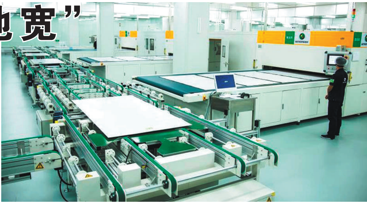
正泰新能源智能工厂。