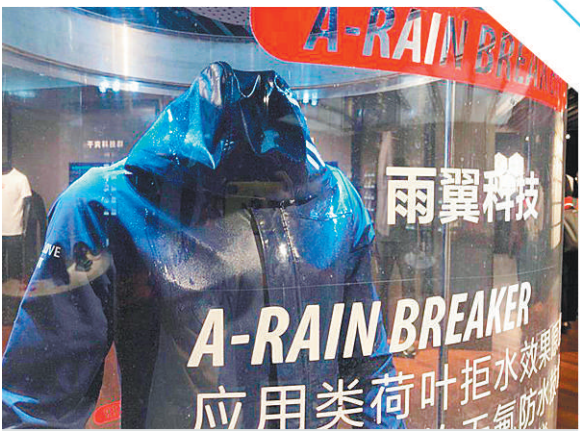
安路集团研发的高科技服装面料。

味。上世纪80年代,“老干妈”的故事随着一瓶瓶别具风味的辣椒酱传遍大江南北。今天,声名远播的“老干妈”做到了“吃水不忘挖井人”,致力于脱贫攻坚及困难户的帮扶工作。