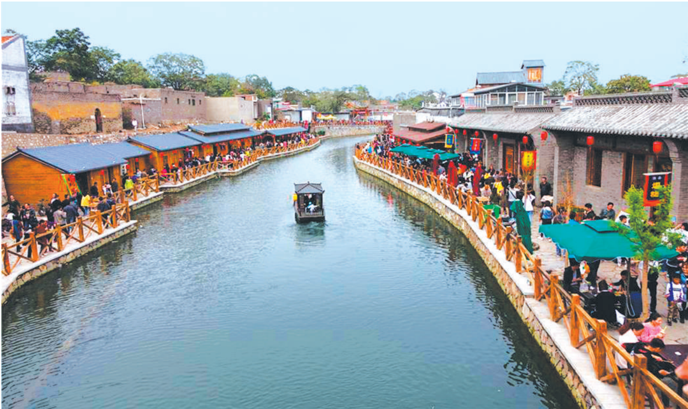
滏阳河改造后打造的响堂水镇引来一批批游客。