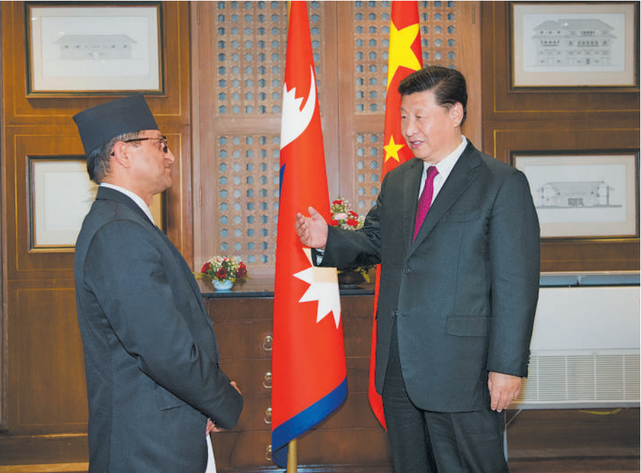
10月12日，国家主席习近平在加德满都下榻饭店会见尼泊尔联邦议会联邦院主席蒂米尔西纳。

新华社加德满都10月12日电（记者黄尹甲子 郝薇薇）国家主席习近平12日在加德满都下榻饭店会见尼泊尔联邦议会联邦院主席蒂米尔西纳。习近平指出，我此次来到尼泊尔访问，虽然抵达时间不