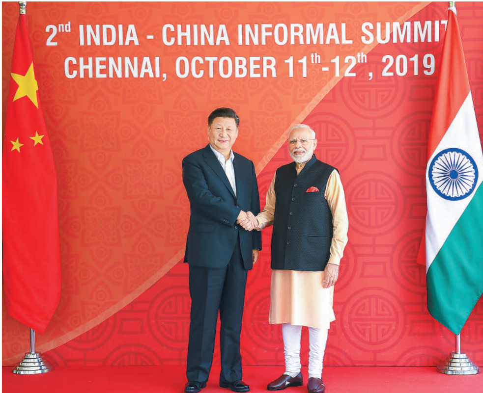
10月12日,国家主席习近平在金奈同印度总理莫迪继续举行会晤。

新华社加德满都10月12日电(记者霍小光 孟娜 孙浩)国家主席习近平12日在加德满都总统府会见尼泊尔总统班达里。两国元首共同宣布,双方将本着同舟共济、合作共赢精神,建立中尼面向发展与繁荣的世代友好的战略合作伙伴关系。 习近平指出,今年4月在北京,你盛情邀请我年内访问尼泊尔。我今天如约而来。正如总统女士所说,中尼之间只有友好和合作。在机场和沿途欢迎人群的脸上,我看到了尼泊尔人民真诚的笑容,感受到了他们对中国人民发自内心的友好,让我再次感受到中尼友好在尼泊尔拥有广泛共识和扎实根基。中尼两国人民心意相通、休戚与共,是邻国友好交往的典范。我希望通过这次访问,传承中尼传统友谊,顺应两国人民期待,推动两国关系更上一层楼。 习近平强调,双方要巩固中尼关系政治基础,把打造命运共同体作为中尼关系发展长远目标。感谢尼方坚定奉行一个中国政策,长期以来给予中方坚定支持。中方将一如既往地支持尼泊尔维护国家独立、主权、领土完整,为尼泊尔经济社会发展提供力所能及的支持和帮助。双方要构建全方位合作格局,开展跨喜马拉雅立体互联互通网络建设,扩大各领域交流合作。 习近平强调,我们刚刚隆重庆祝了新中国成立70周年。这70年,是中国共产党带领中国人民在实现中华民族伟大复兴征程中走过的70年。这是一条不平凡的路,既有鲜花和掌声,也伴随坎坷和挑战。我们会继续深化改革、扩大开放,推动实现高质量发展。一个稳定、开放、繁荣的中国将始终是尼泊尔和世界发展的机遇。 班达里热烈欢迎习近平主席访问尼泊尔,并再次祝贺中国人民共