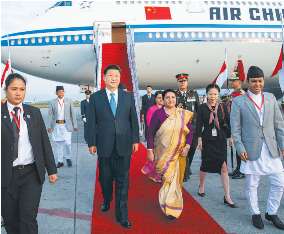
10月12日,国家主席习近平乘专机抵达加德满都,开始对尼泊尔进行国事访问。习近平步出舱门,尼泊尔总统班达里偕女儿乌莎在舷梯旁热情迎接。