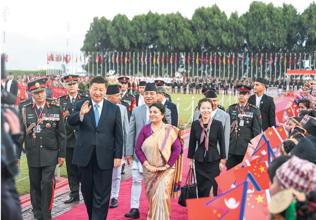
10月12日,国家主席习近平乘专机抵达加德满都,开始对尼泊尔进行国事访问。尼泊尔总统班达里在机场为习近平举行具有浓郁尼泊尔民族特色的欢迎仪式。