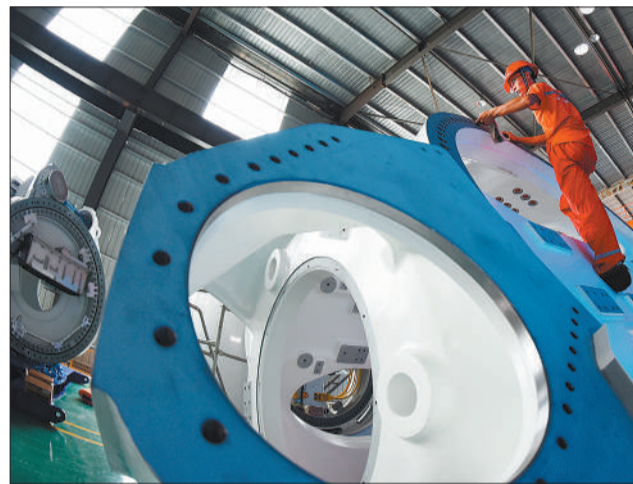
金风科技集团已发展成为全球领先的清洁能源和节能环保整体解决方案供应商，业务遍布全球二十多个国家和地区。