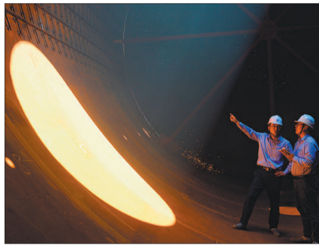
中建安装集团五洲工程装备公司承建青岛西海岸新区董家口循环经济产业园丙烷脱氢装置制造项目，实现了百名电焊工采用埋弧自动焊接等多种焊接工艺焊接分离塔的壮举。