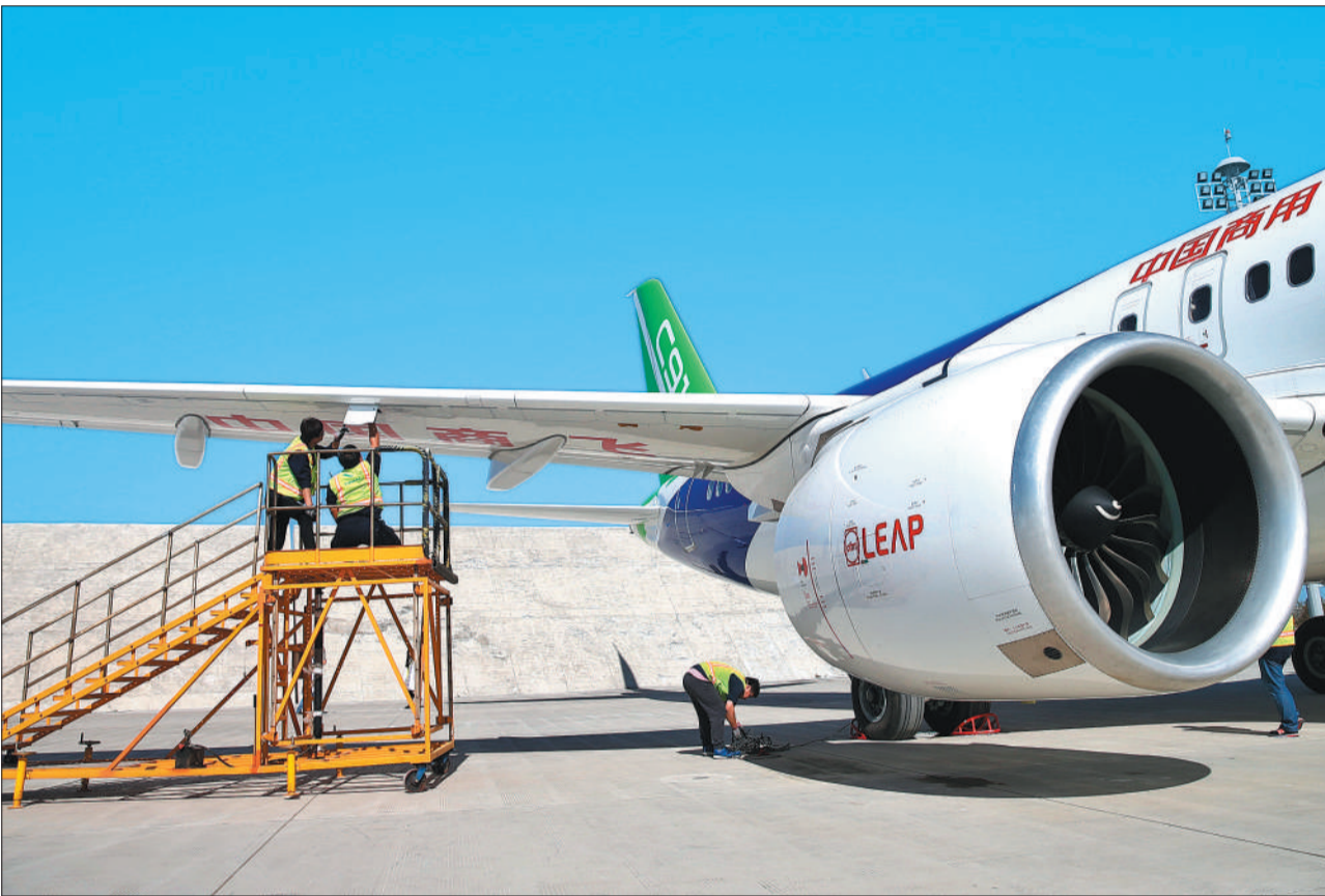
技术人员对C919国产大飞机进行飞行前的检查。国产大飞机研发下线标志着我国航空高端制造业向前迈出一大步。