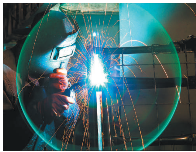
湖北省十堰市郧阳经济开发区伟士通汽车零部件有限公司，工人正在生产线上作业。