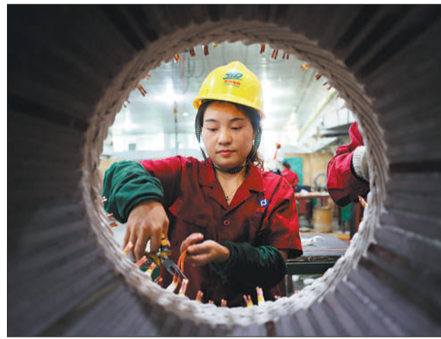
江西省分宜县工业园区宏大煤矿电机制造公司员工赶订单。近年来，该县进一步落实工业强县战略，不断优化营商环境，推进企业高质量发展。