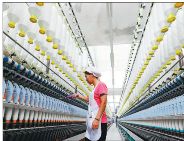
位于江苏省海安市曲塘镇的南通双弘纺织有限公司的员工在纺纱生产线上作业。