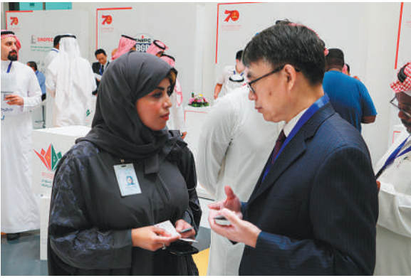
图为应聘者(左)与用工企业交流。

本报利雅得电 记者宋博奇报道:日前,中国驻沙特大使馆和沙特中资企业协会联合沙特国际战略伙伴中心在沙特首都利雅得苏尔坦亲王大学举办了中沙人才专场招聘会,19家中资企业及数百名沙特毕业生参加了活动。 近年来,随着中沙关系持续快速发展,越来越多的中资企业落户沙特。在沙中资企业不仅在能源、电力、基础设施建设等传统领域深耕市场,也在电子商务、通信等新兴产业中大胆探索,为沙特经济社会发展贡献了中国智慧和力量,为两国经贸合作注入了生机和活力。中国驻沙特大使陈伟庆表示,中沙人才招聘会是中国企业履行社会责任、加强属地经营、深入参与沙特经济社会发展的有益尝试。中方愿与沙方一道,开创性地开展多种形式的人力资源合作。