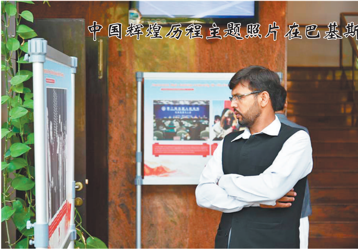
中国辉煌历程主题照片在巴基斯坦展出

本报新加坡电 记者蔡本田报道:新加坡经济发展局日前公布的数据显示,新加坡制造业产值连续4个月下降,8月份同比下降8%,是过去44个月以来最大跌幅,创近4年来新低。如果不含生物医药制造业,则产值同比下降两位数,达12.4%。 经季节性调整后,8月份制造业产值环比下降7.5%。如果不包括生物医药制造业,则产值环比下降12.1%。8月份,生物医药制造业、一般制造业、化学制造业、交通工程等行业分别增长10.6%、5.8%、2.7%、0.5%;电子业和精密工程制造业降幅较大,达到两位数。电子业产值降幅最大,同比下降24.4%,刷新自2012年1月份以来的最大降幅纪录。其中,半导体产值下降29.6%,电子模具和零部件产值下降18.4%,电子业相关产值下降11.2%,数据储存和资讯通信产值增长25%,消费者电子领域产值增长6.3%。