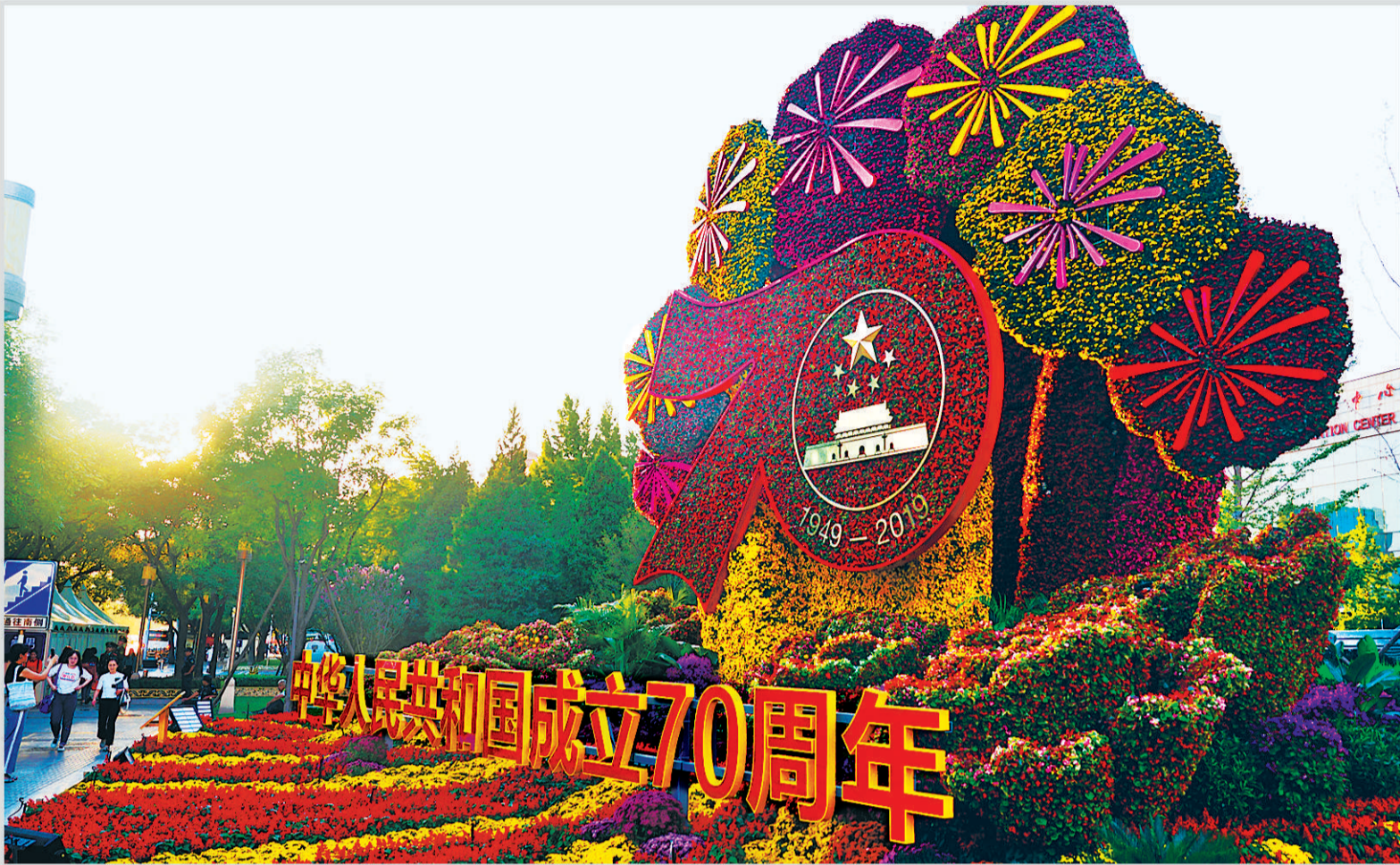
北京长安街沿线迎国庆立体花坛造型多样,吸引众多市民观赏。

刚刚过去的暑期,一部名为《哪吒之魔童降世》的影片引发观影热潮。这些年,我国的电影市场很是热闹,既有《战狼》系列、《红海行动》等主流电影激荡人心,又有《流浪地球》