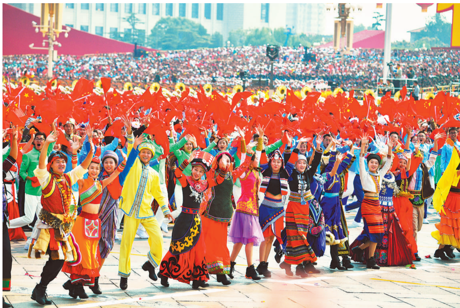
庆祝中华人民共和国成立70周年大会上的群众游行方阵。