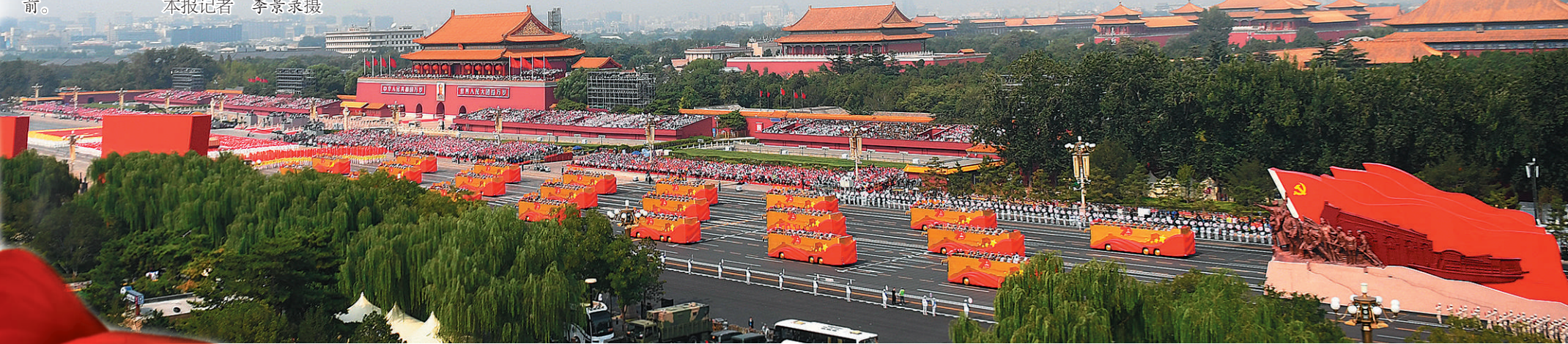
下图 10月1日，庆祝中华人民共和国成立70周年大会在北京天安门广场隆重举行，图为“致敬”方阵行进在天安门城楼前。