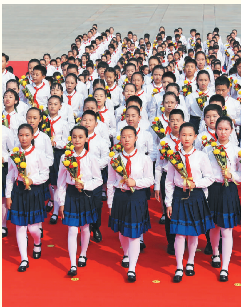
9月30日，烈士纪念日向人民英雄敬献花篮仪式在北京天安门广场隆重举行。图为少先队员向英烈献花。