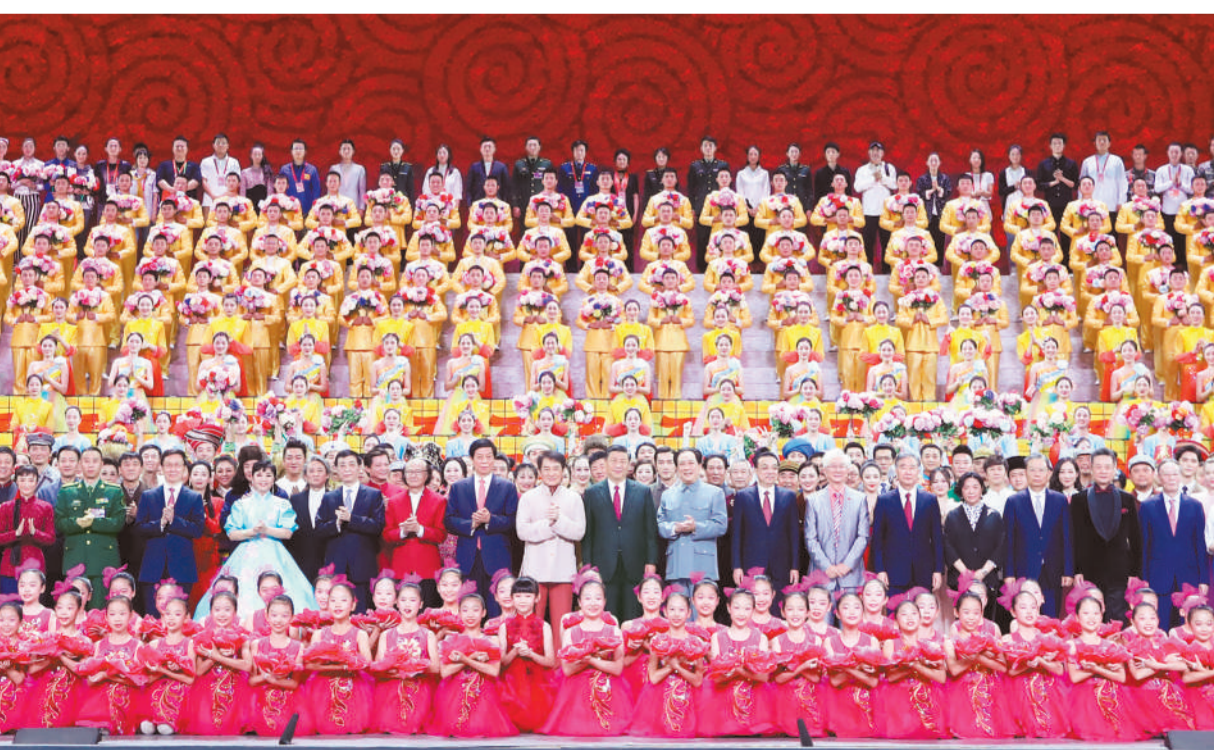
9月29日,庆祝中华人民共和国成立70周年大型文艺晚会《奋斗吧 中华儿女》在北京人民大会堂举行。习近平、李克强、栗战书、汪洋、王沪宁、赵乐际、韩正、王岐山等党和国家领导人同4000多名观众一起观看演出。演出结束后,习近平等走上舞台同演职人员合影留念。

第二篇章“艰苦奋斗”以绚丽宏大的合唱和舞蹈《东方红》开篇,回顾新中国火热朝天的社会主义革命和建设年代。《赞歌》《翻身农奴把歌唱》唱出各族儿女开启新生活的无尽喜悦,《英雄赞歌》《我的祖国》讴歌保家卫国的爱国情怀,《我们走在大路上》《我为祖国献石油》抒发敢