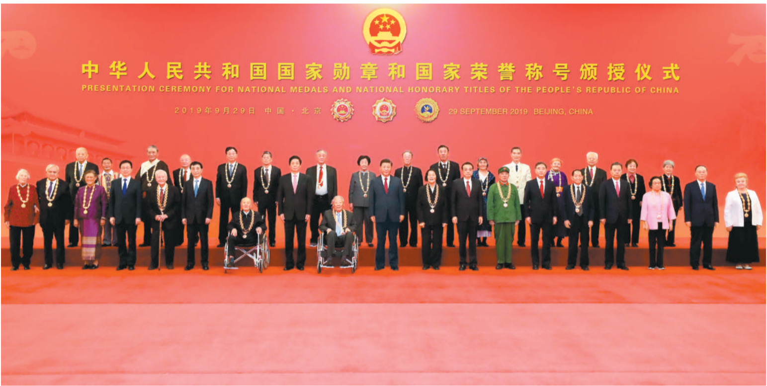
9月29日,中华人民共和国国家勋章和国家荣誉称号颁授仪式在北京人民大会堂金色大厅隆重举行。中共中央总书记、国家主席、中央军委主席习近平向国家勋章和国家荣誉称号获得者颁授勋章奖章并发表重要讲话。