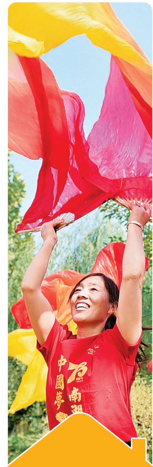
9月22日,河北省南宮市居民在公园健身舞蹈,喜迎国庆。

公共服务水平显著提高 2004年至2018年,全国公共设施管理业投资年均增长 23.3% ,显著改善了城市基本公共服务能力。 2018年末 80亿元/平方公里 2018年末 64万公里 2017年末 2亿元/平方公里 2017年末 2万公里