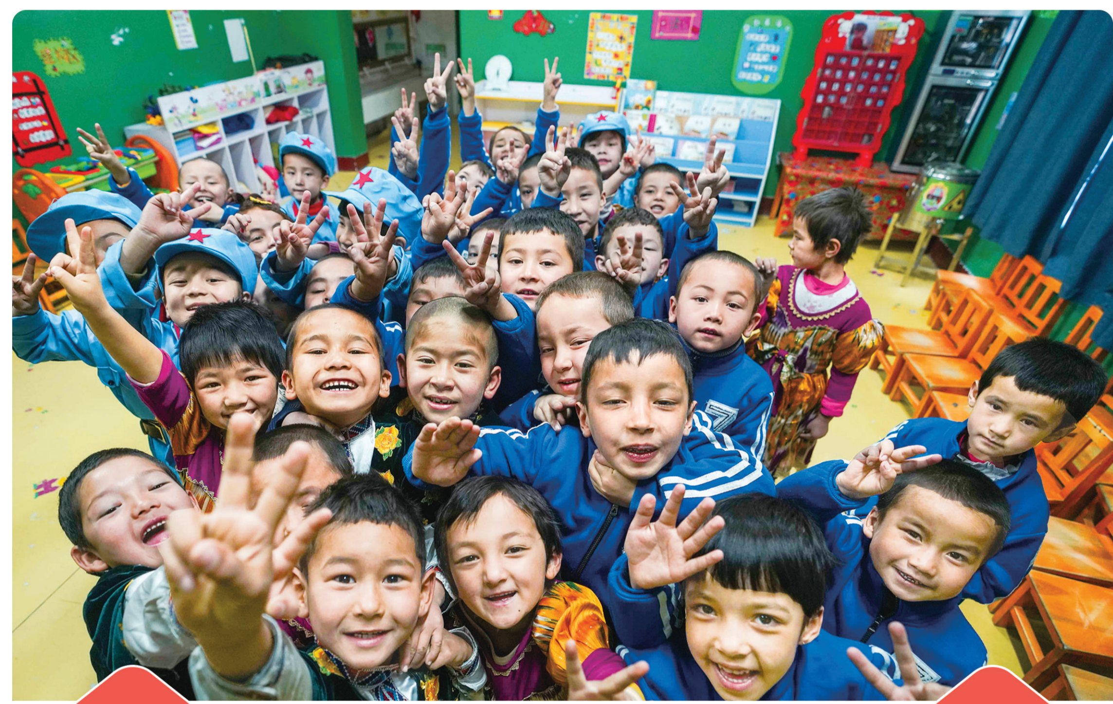
2019年2月13日,新疆和田地区于田县先拜巴扎镇良种场村的幼儿园里,孩子们在一起玩耍。

就业规模不断扩大 1949年 1533 1978年 9514 2018年 43419 全国就业人员 77586 城镇就业人员 40152 特别是党的十八大以来,全国城镇就业总量增加了 6300多万人 ,平均每年增加 1000万人 以上