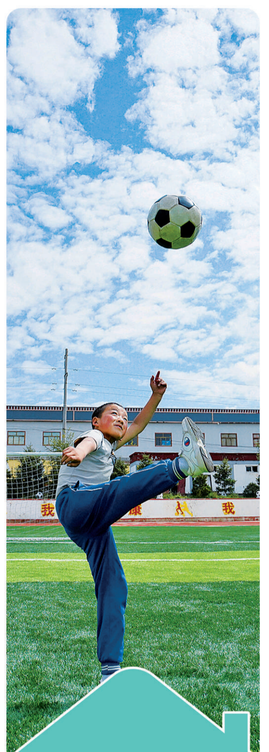
8月27日,在甘肃省甘南藏族自治州合作市,一名学生在操场踢足球。

居住环境更加美丽 从新中国成立初期的“绿化祖国”运动,到改革开放后的“园林城市”创建,再到现在的“绿色城市”和“美丽中国”建设,我国园林绿化事业快速发展。 2017年末 全国城市公园 15633个 1.5平方千米 14.1平方千米 免费公园 14555个 城市建成区绿化覆盖率 比1986年末 提高 24个百分点 40.9%