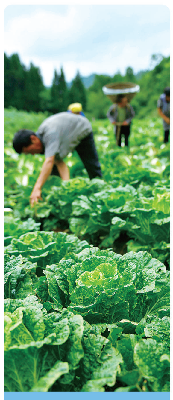
湖北恩施州鹤峰高山无公害蔬菜种植作为促进高山山区农民精准扶贫、精准脱贫的支柱产业,因为湖北省鹤峰县鹤峰乡中村特有的蔬菜在采收蔬菜。