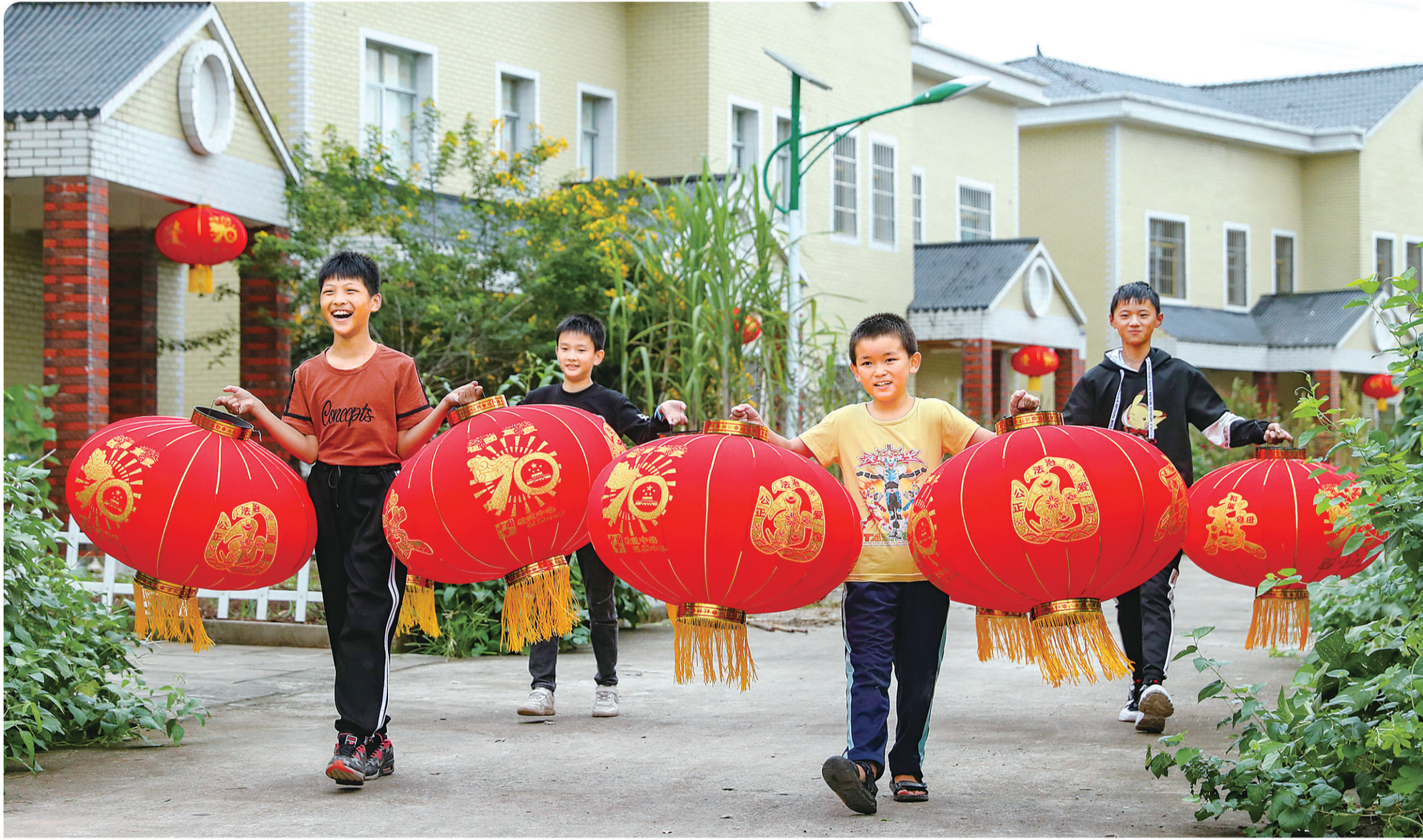
9月18日,四川省定贫困村华莹市明月镇竹河村从渠江水港区搬进新村小洋房的孩子,开心地提着大红灯笼准备悬挂在新居大门口。