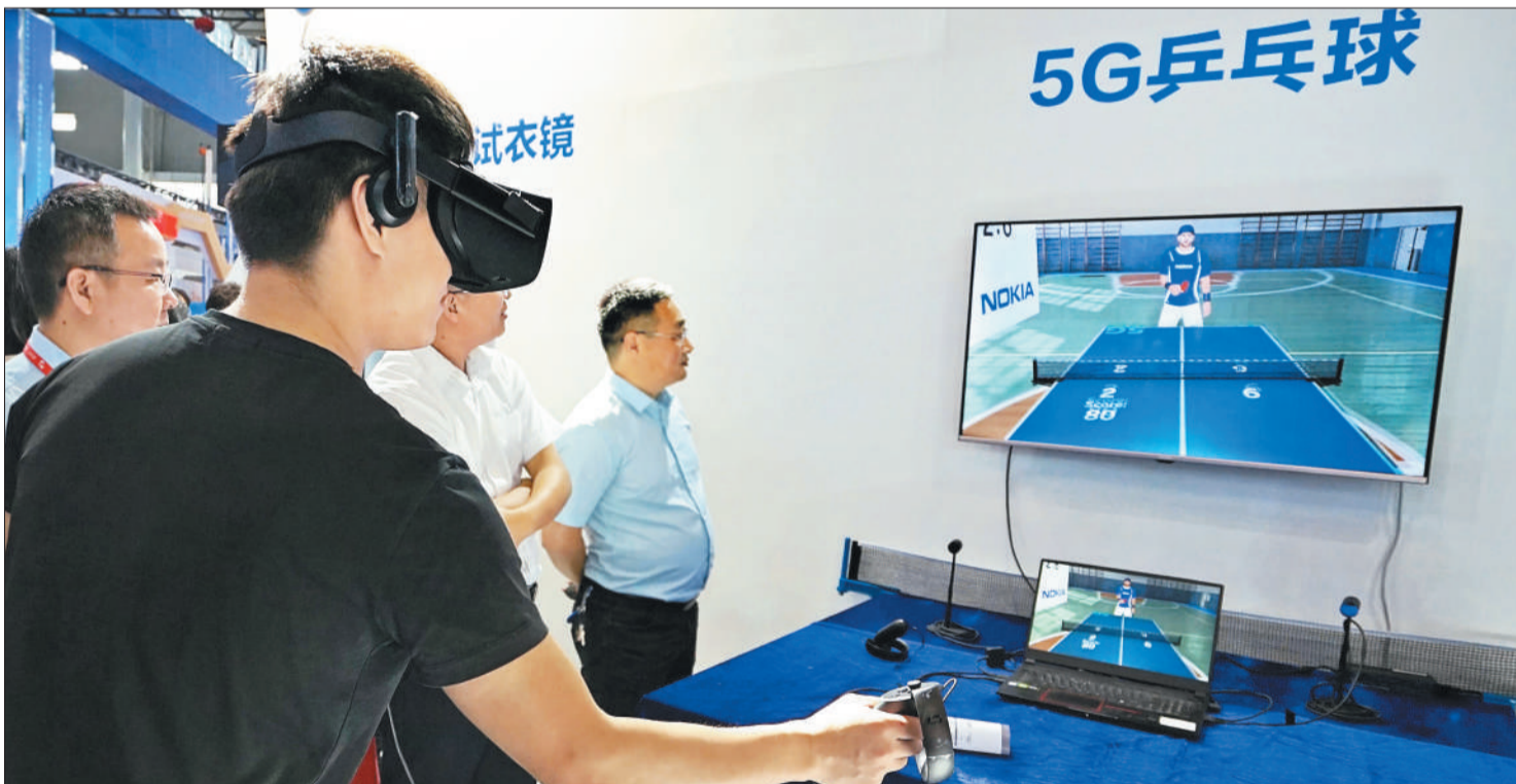
▼2019世界制造业大会在安徽省合肥市举行，在数字一体化展区，观众在体验5G乒乓球“比赛”。