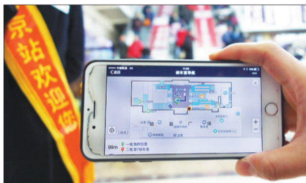
▲乘客手机一摇，即可进入北京站推出的“导航和客运综合服务系统”，享受多种出行服务。 本报记者 翟天雪摄