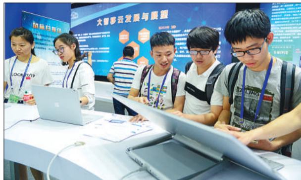
▲河北省廊坊市经贸洽谈会上，“大智移云”受到观众关注。