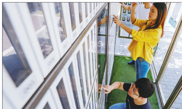
▲江西省南昌市东湖区豫章街道“24小时智慧书屋”，读者在借阅书籍。智慧书屋为广大市民提供方便的自助阅读服务。