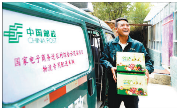
▲青海省海南州共和县后菊花村，青海邮政分公司员工在搬运农产品。依托邮政农村电商服务平台，当地的农产品可销往全国各地。