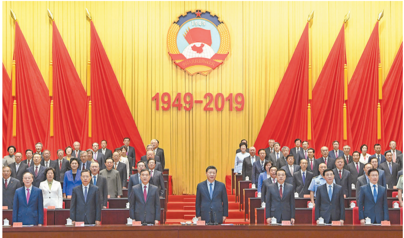
9月20日,中央政协工作会议暨庆祝中国人民政治协商会议成立70周年大会在全国政协礼堂召开。中共中央总书记、国家主席、中央军委主席习近平出席大会并发表重要讲话。