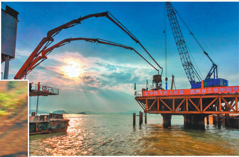
上图 港珠澳大桥修建过程中,海上专用混凝土工作船对钻孔桩内浇筑海上施工专用混凝土,防止污染环境。(资料照片)