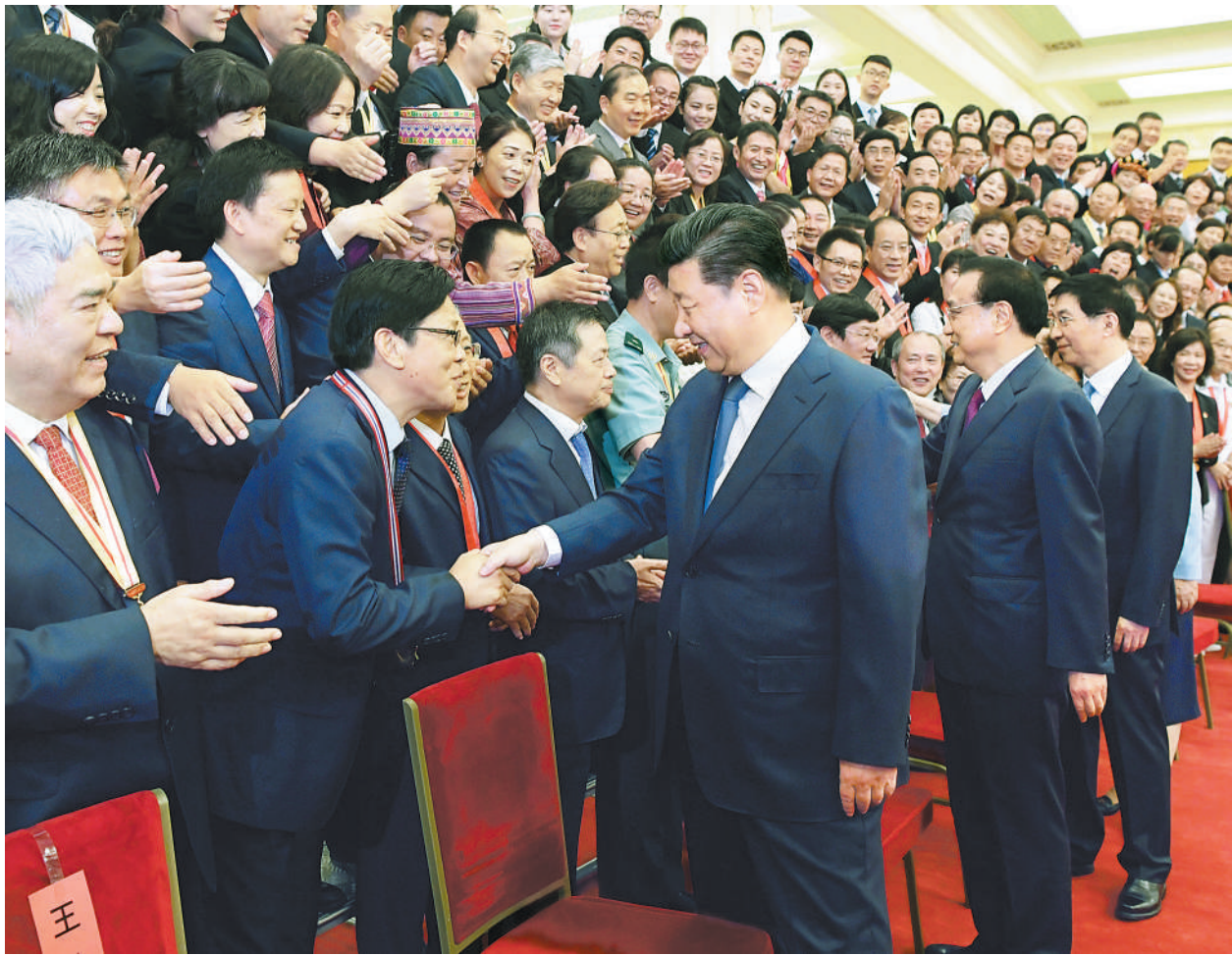
9月10日,党和国家领导人习近平、李克强、王沪宁等在北京人民大会堂会见庆祝2019年教师节暨全国教育系统先进集体和先进个人表彰大会受表彰代表。

会上表彰了718名“全国模范教师”、79名“全国教育系统先进工作者”、597个“全国教育系统先进集体”,以及1432名“全国优秀教师”、158名“全国优秀教育工作者”,授予1355项“国家级教学成果奖”。此前,教育部等还推选了10位“全国教书育人楷模”。