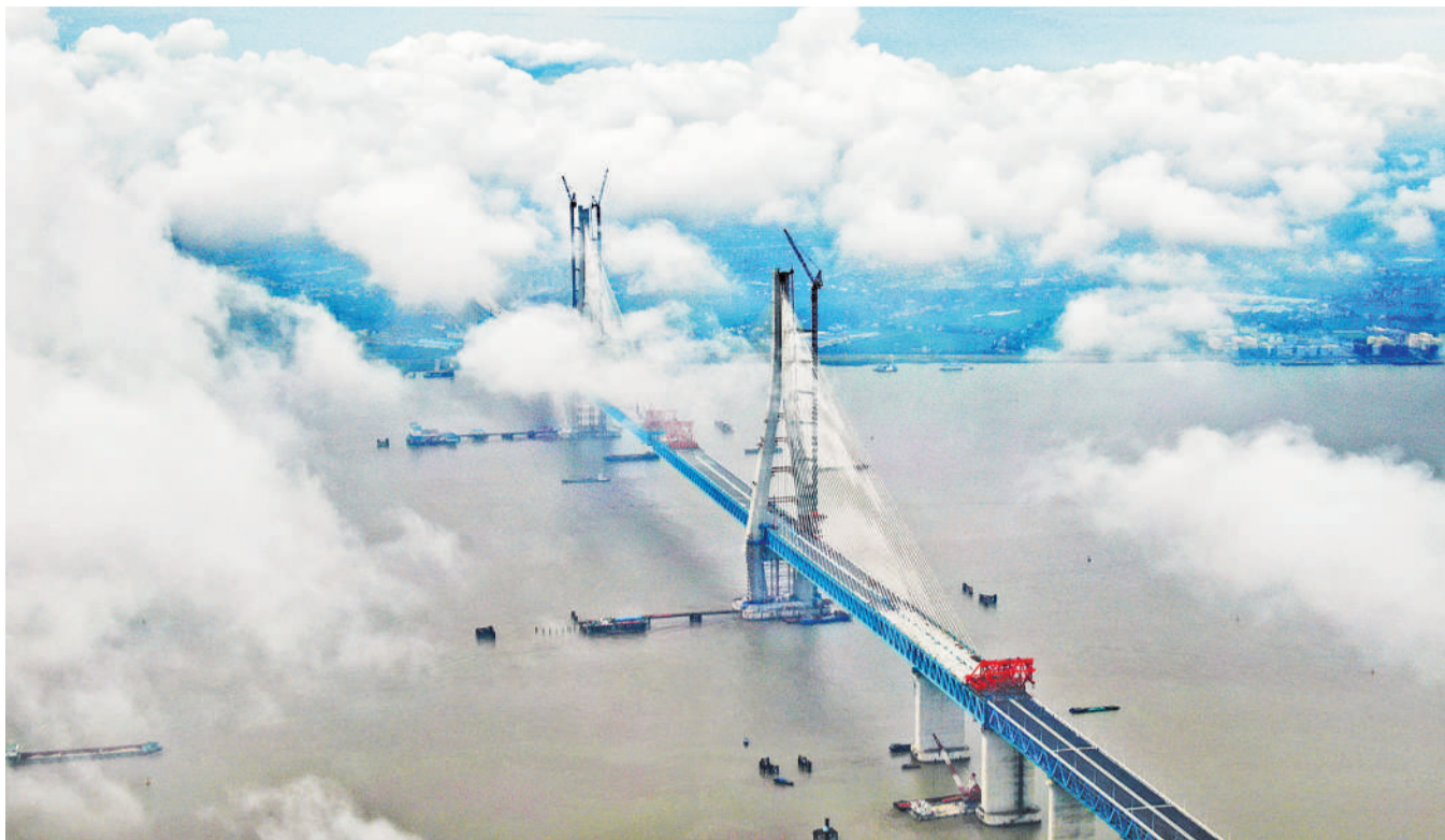
9月3日,无人机航拍云雾缭绕中的沪通长江大桥。沪通长江大桥近日将迎来重大工程节点——主跨合龙。大桥明年建成后将成为沿海重要的铁路、公路过江通道,在促进长三角社会经济一体化等方面具有重要意义。

基础设施是国民经济发展的先导和基石。在新时代推动基础设施建设,必须贯彻落实高质量发展的重要理念。要按照国家战略的调整和需要,精准进行基础设施布局。同时,进一步弥补创新引导和协调发展等方面的短板,着重提高基础设施的供给质量和供给效率——