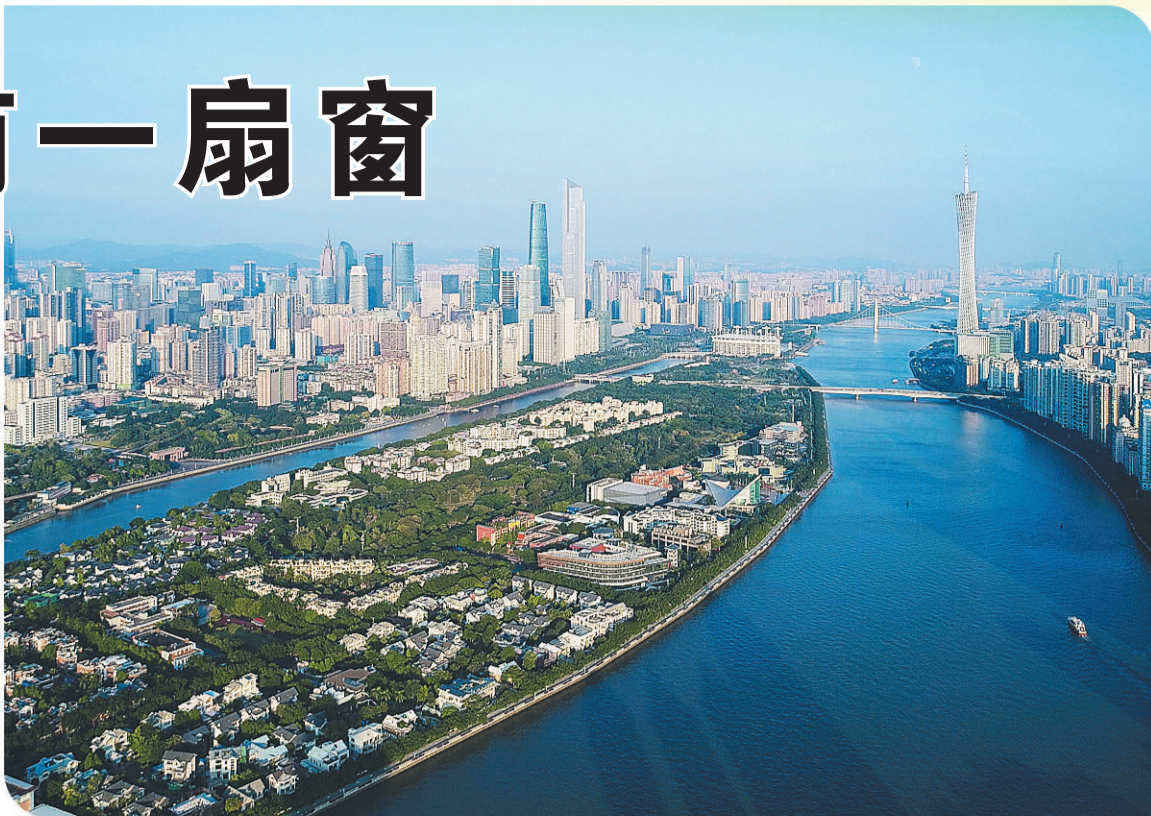
广州二沙岛绿意盎然。