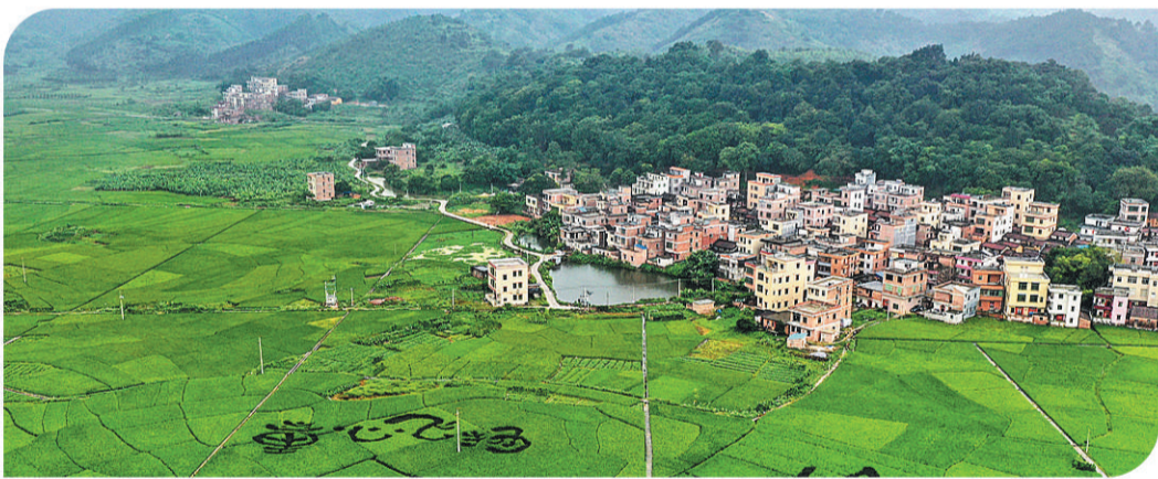
广东省肇庆市德庆县悦城镇罗洪村的稻田画。

城乡区域发展不平衡是广东高质量发展的最大“短板”。随着“千村示范、万村整治”“万企帮万村”“粤菜师傅”等重点工程的推进，广东在乡村振兴战略、扶贫攻坚战略实施中遇到的“硬