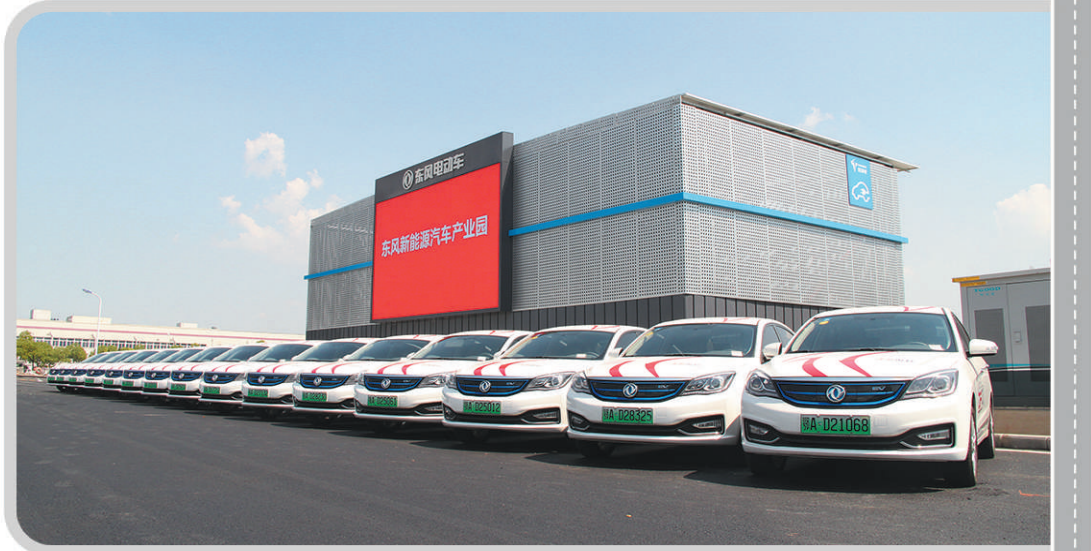
图为总投资108亿元的东风新能源汽车产业园。