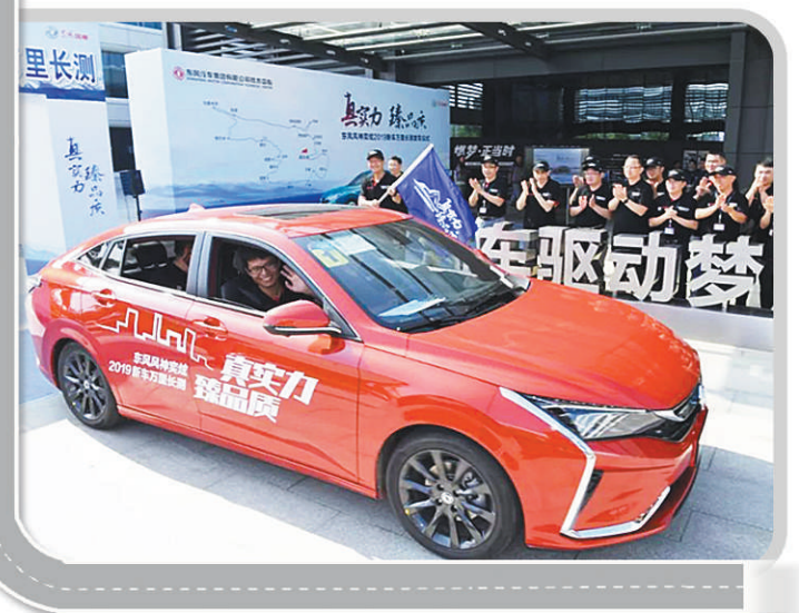
下图 东风风神奕炫2019年新车万里长测发车仪式现场。