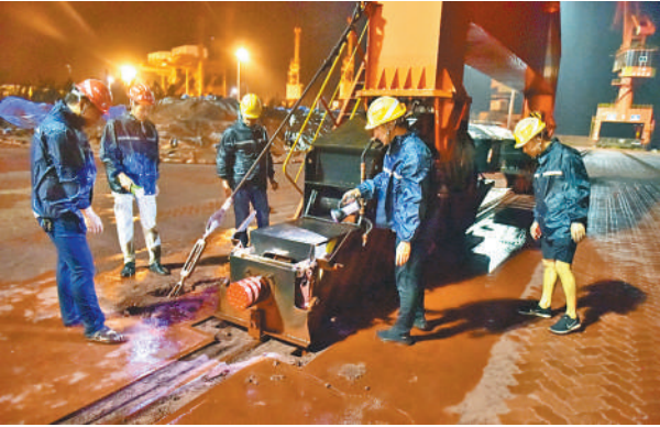
近日，工作人员在福建漳州九龙江古雷码头进行防汛安全巡查。

对此，水利部水旱灾害防御司司长田以堂表示，一方面，水利部门要早做预报，做好防御工作；另一方面，要做好华西地区山洪灾害的防御工作。此外，要做好水库的安全运用，发生秋汛以后，如果水库运用不好，不能够事先预泄拦洪，就有可能导致下游发生洪涝灾害。小型水库要按照水利部提出的“三个责任人”“三个重点环节”做好防御工作，大中型水库要做好防洪调度，充分发挥水库的功能。