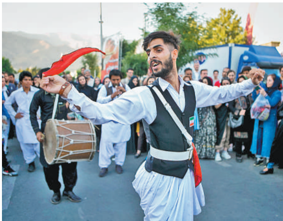
伊朗首都德黑兰日前举办第四届德黑兰传统游牧文化展。图为身着传统服饰的村民在游牧文化展上表演传统舞蹈。（新华社发）