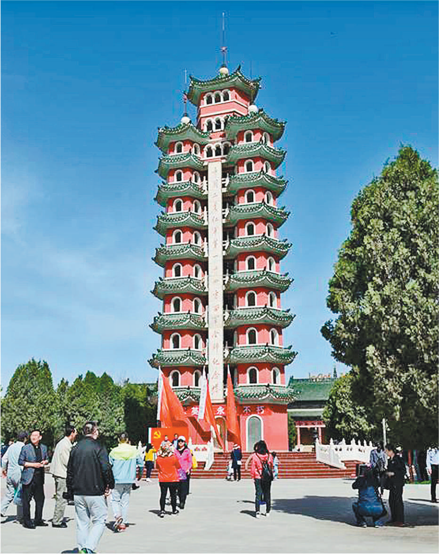
中国工农红军第一、二、四方面军会师纪念碑。

红军攻克腊子口之后，穷追敌人90多里，占领了岷县的大草滩，缴获粮食数十万斤，还有2000多斤食盐，给刚刚走出草地的部队给养以极大补充。腊子口是红军北上的最后一道天险。夺取腊子口的胜利，为红军在陕甘开辟新的根据