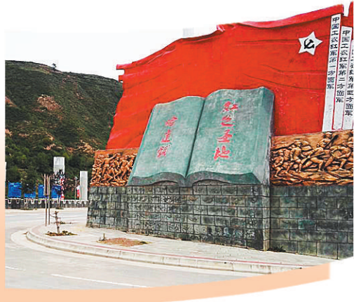
甘肃宕昌县哈达铺镇三军纪念碑。