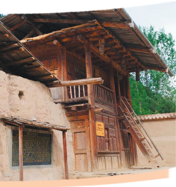
甘南迭部县高吉村俄界会议旧址毛泽东居室。

弘扬长征精神，实现奋斗目标，必须加强党的领导、从严管党治党。党的坚强领导是红军长征胜利的首要条件。正是由于红军坚持了党中央的集中统一领导，才经受住了残酷战争环境、恶劣自然条件、严酷党内斗争等多重考验，创造出绝处逢生、反败为胜的奇迹。长征队伍有着极为严明的政治纪律、组织纪律、军事纪律、群众纪律，这是保证政治方向一致、组织团结统一、军事令行禁止、军民关系和谐的关键所在。在新的长征路上，我们要把坚持和加强党的领导贯穿始终，扛好全面从严治党的政治责任，以党的政治建设为统领，统筹推进党的建设各项工作，为事业发展提供坚强保证。要严明党的政治纪律和政治规矩，树立正确选人用人导向，营造风清气正的政治生态。要严格落实中央八项规定及实施细则精神，持续整治“四风”特别是形式主义、官僚主义问题，扎实推进以察政治要件落实治风治事治德、察中部署落地治政令梗概、察领导机关作风治文山会海、察领导干部履职治政不严不实为主要内容的“四察四治”专项行动，让求真务实干事创业、严于律己尽责成为广大党员干部的价值追求和行为规范。要坚持无禁区、全覆盖、零容忍，坚持重遏制、强高压、长震慑，巩固发展反腐败斗争压倒性胜利，以从严治党治党的实际成效更好保障建设幸福美好新甘肃，努力以优异成绩庆祝新中国成立70周年。