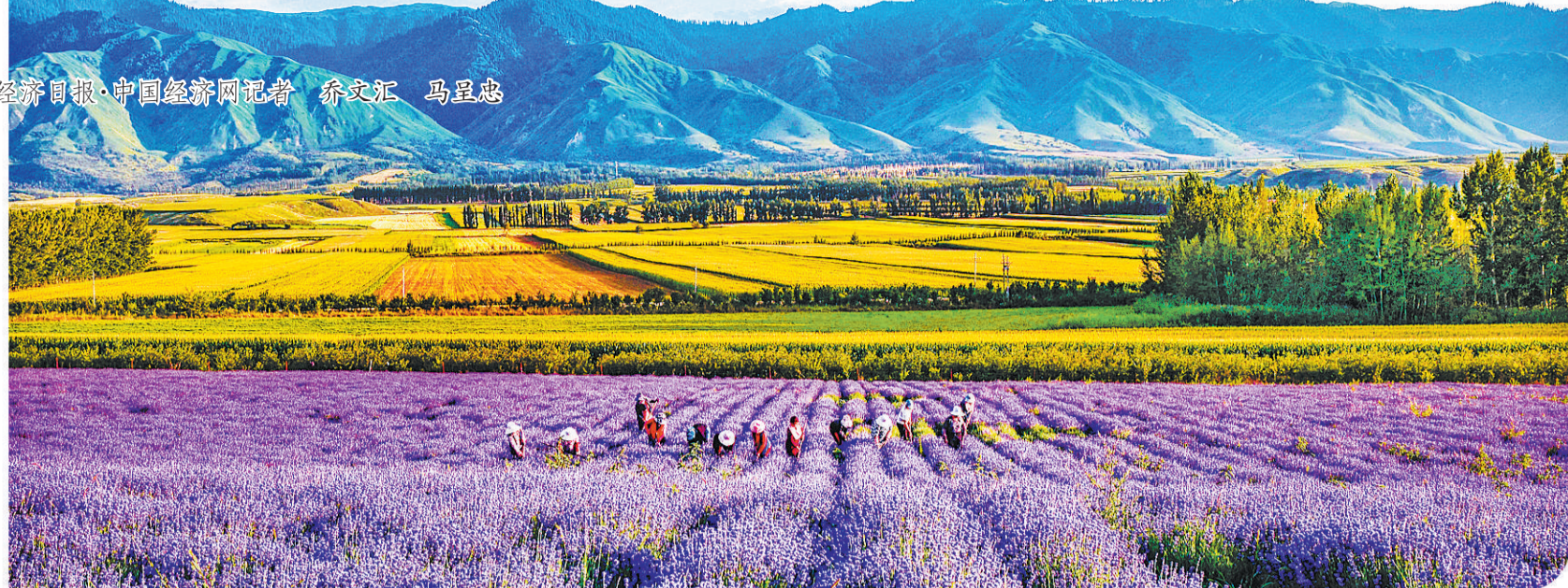
兵团第四师地处伊犁河谷,在我国率先引进、种植薰衣草,填补了我国薰衣草产业的空白。