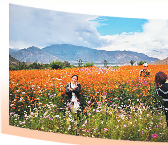
游客在拉萨市重点打造的特色村落达东村游玩拍照。

党的十八大以来,以习近平同志为核心的党中央高度重视西藏工作,不断推进西藏长足发展和长治久安。在习近平新时代中国特色社会主义思想指引下,西藏各族人民正与全国人民一道,为创造更加幸福美好的生活、实现中华民族伟大复兴而奋斗。