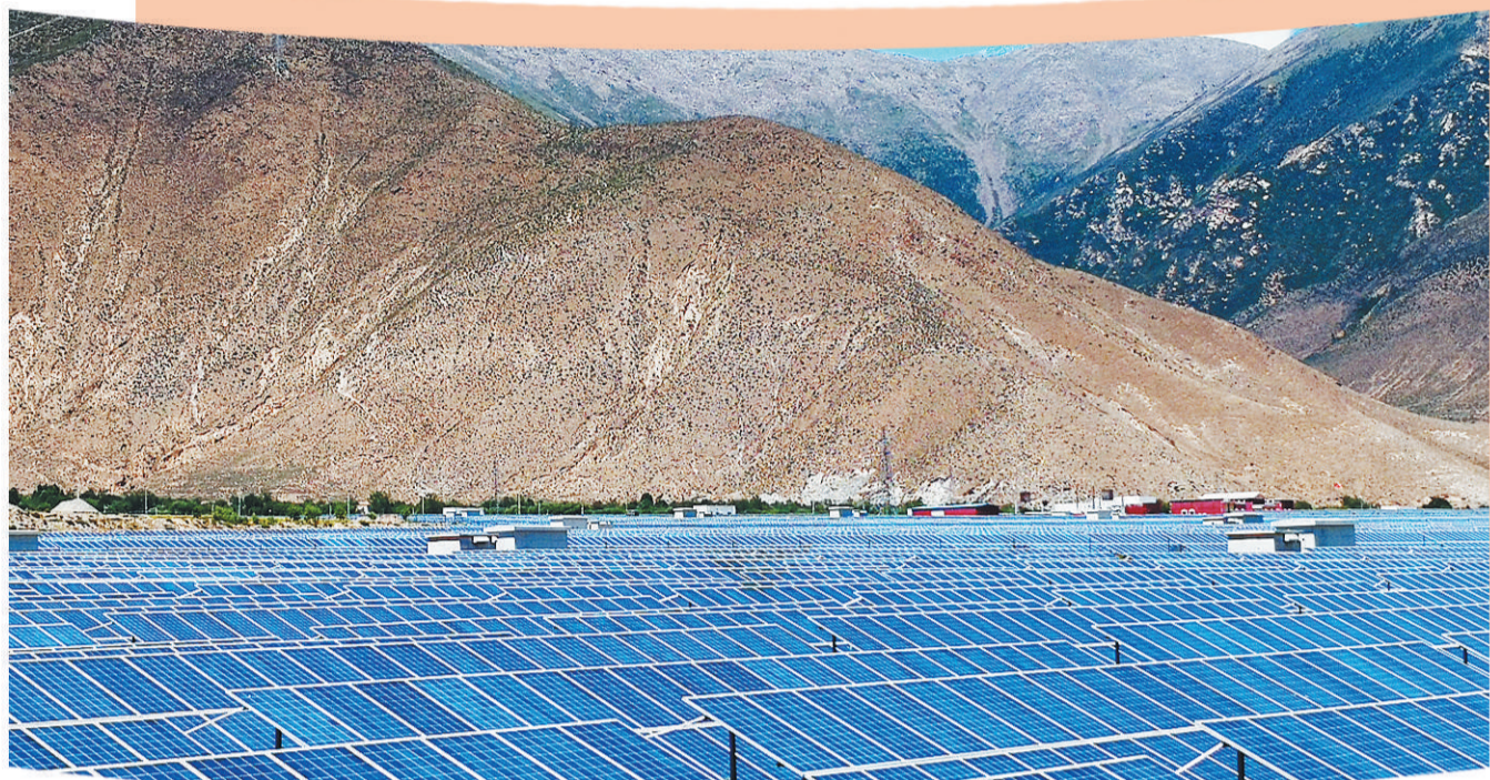
依托丰富的太阳能资源,山南市大力发展光伏发电产业,不仅有效缓解了电力紧张问题,还为当地群众创造了就业机会,带动群众增收。图为山南市桑日镇光伏产业园区一角。