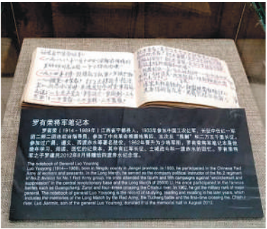
四渡赤水纪念馆内展出的罗有荣将军生前所使用的笔记本，其中记录了朱德在中央红军一渡赤水时，向红军战士讲话的内容。