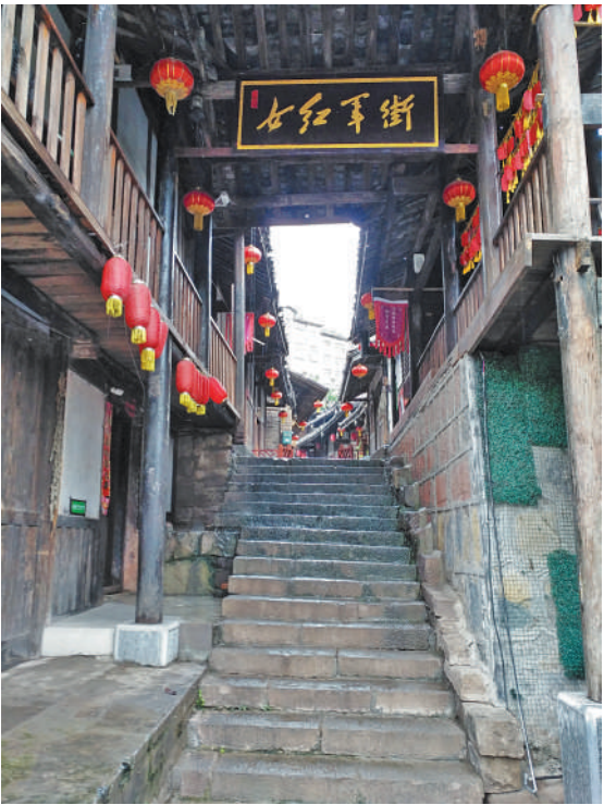
位于贵州省习水县土城古镇的女红军街。

心中有信仰，脚下就会有力量。这就是共产主义理想信念武装起来的革命队伍，他们为理想而来，为信仰而战，拥有无法战胜的力量。