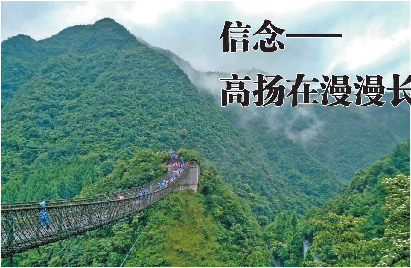
贵州遵义娄山关。中央红军曾两次与国民党黔军血战于此。