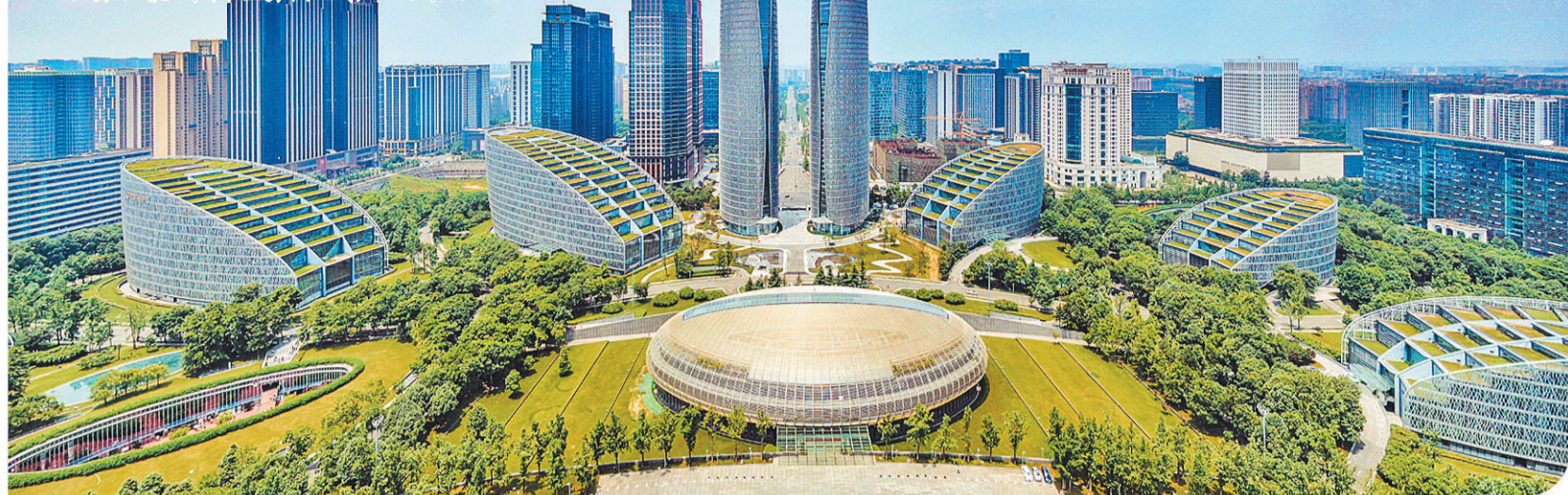
从四川成都金融城高处远眺，锦江在侧，交子公园如一片“绿毯”延伸开去。