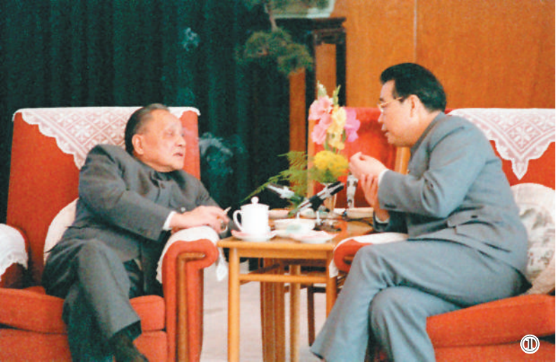
图① 1988年,邓小平同志与李鹏同志在北京人民大会堂福建厅交谈。