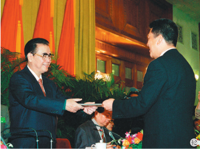
图⑫ 1998年5月5日,全国人民代表大会澳门特别行政区筹备委员会在北京人民大会堂宣告成立并举行第一次全体会议。这是李鹏同志为筹备委员会副主任委员何厚铨颁发任命书。