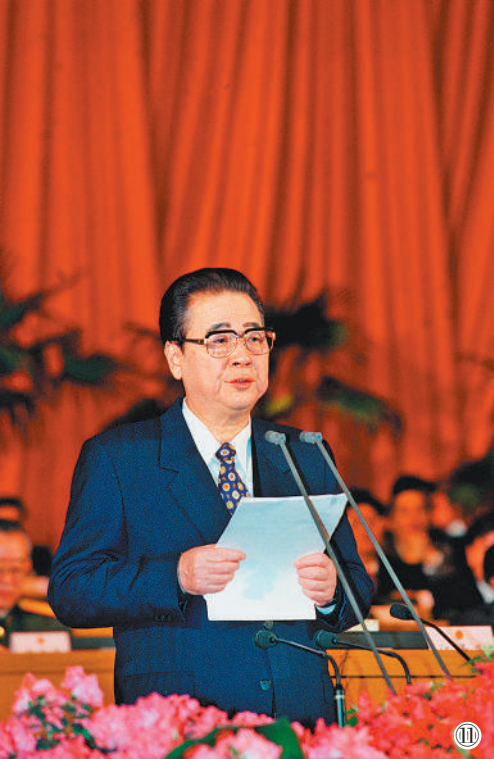
图⑪ 1998年3月19日,九届全国人大一次会议在北京人民大会堂胜利闭幕。李鹏同志在闭幕式上讲话。