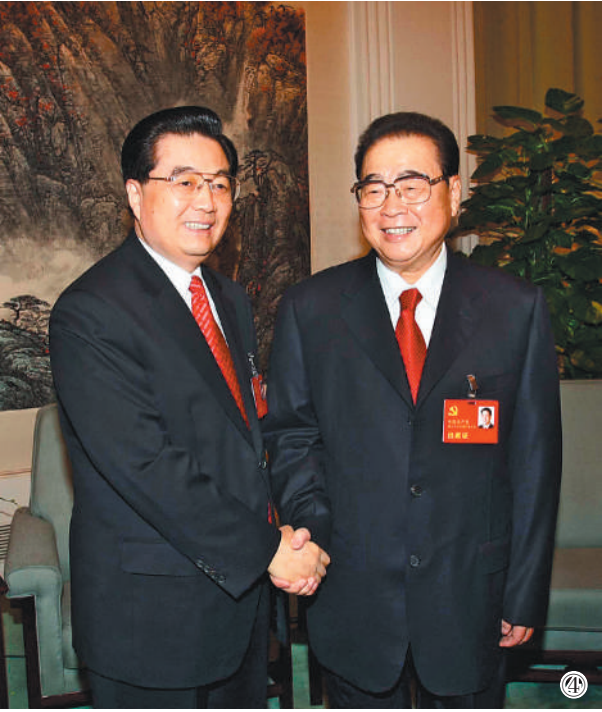
图④ 2007年10月21日,在党的十七大闭幕前,胡锦涛同志同李鹏同志在一起。