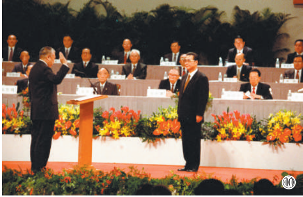
图⑩ 1997年7月1日凌晨,中华人民共和国香港特别行政区成立暨特区政府宣誓就职仪式在香港会议展览中心新翼七楼隆重举行。香港特区首任行政长官董建华宣誓就职,李鹏同志监誓。