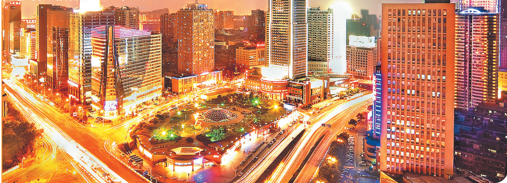
长沙市芙蓉路与五一大道交汇成“金十字”，构成长沙芙蓉CBD核心区，支撑起长沙的产业基底。